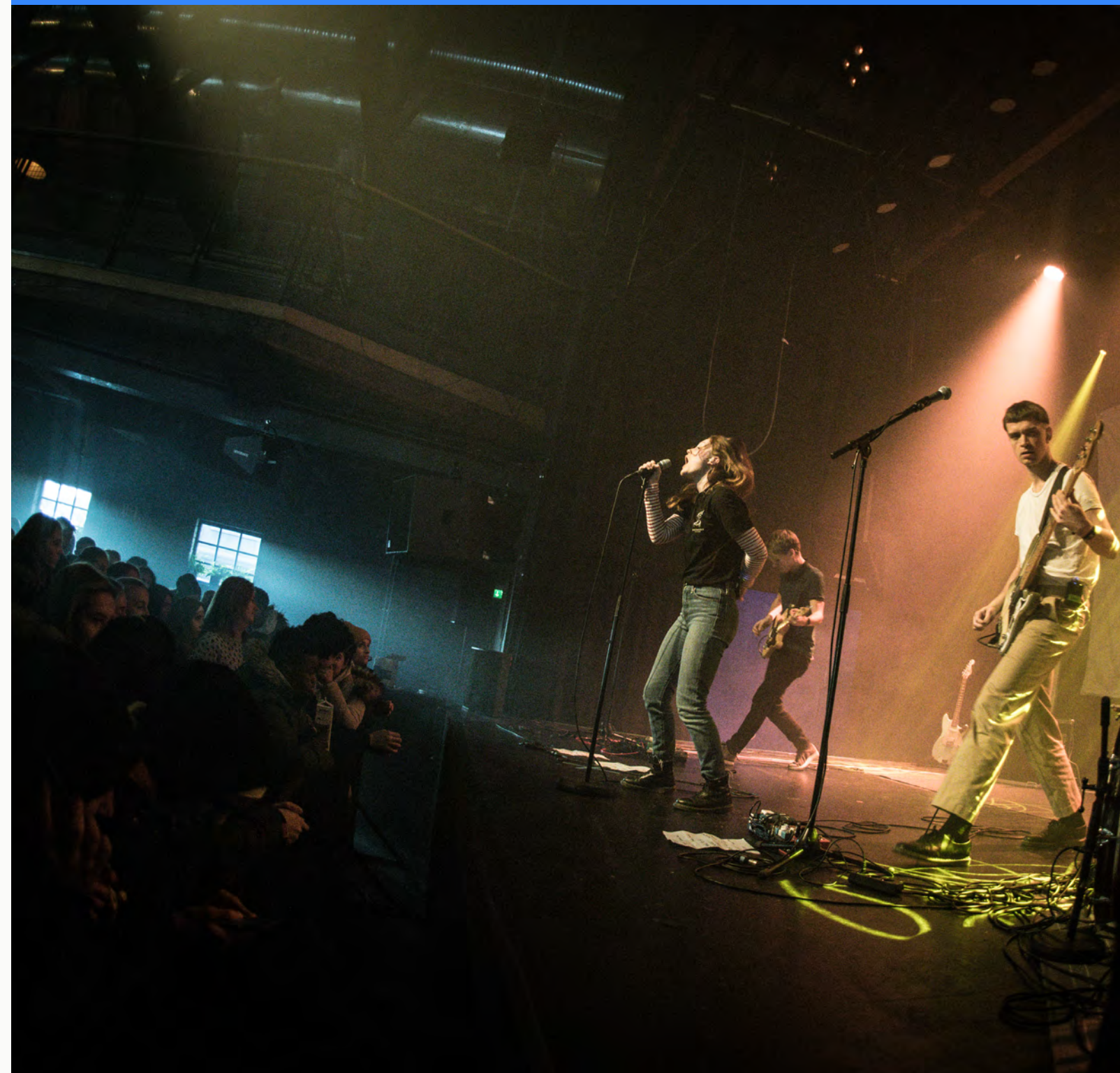
Formiddagspunk med feministisk trøkk. Elevar ved vidaregåande skular i heile Buskerud vart i haust vitja av Slotface

Skulekonsertordninga opphøyrd formelt 13. august 2018. Vårsesongen 2018 var den siste i saga om skulekonsertordninga, og øyremerkte midlar vart tildelte for siste gong. I samband med avvikling av ordninga vart den tilhøyrande TONO-avtalen sagt opp frå og med 1. januar 2019. Konsertutstyr frå lageret til Kulturtanken vart distribuert til tilskotsmottakarane våre etter søknad og behov.