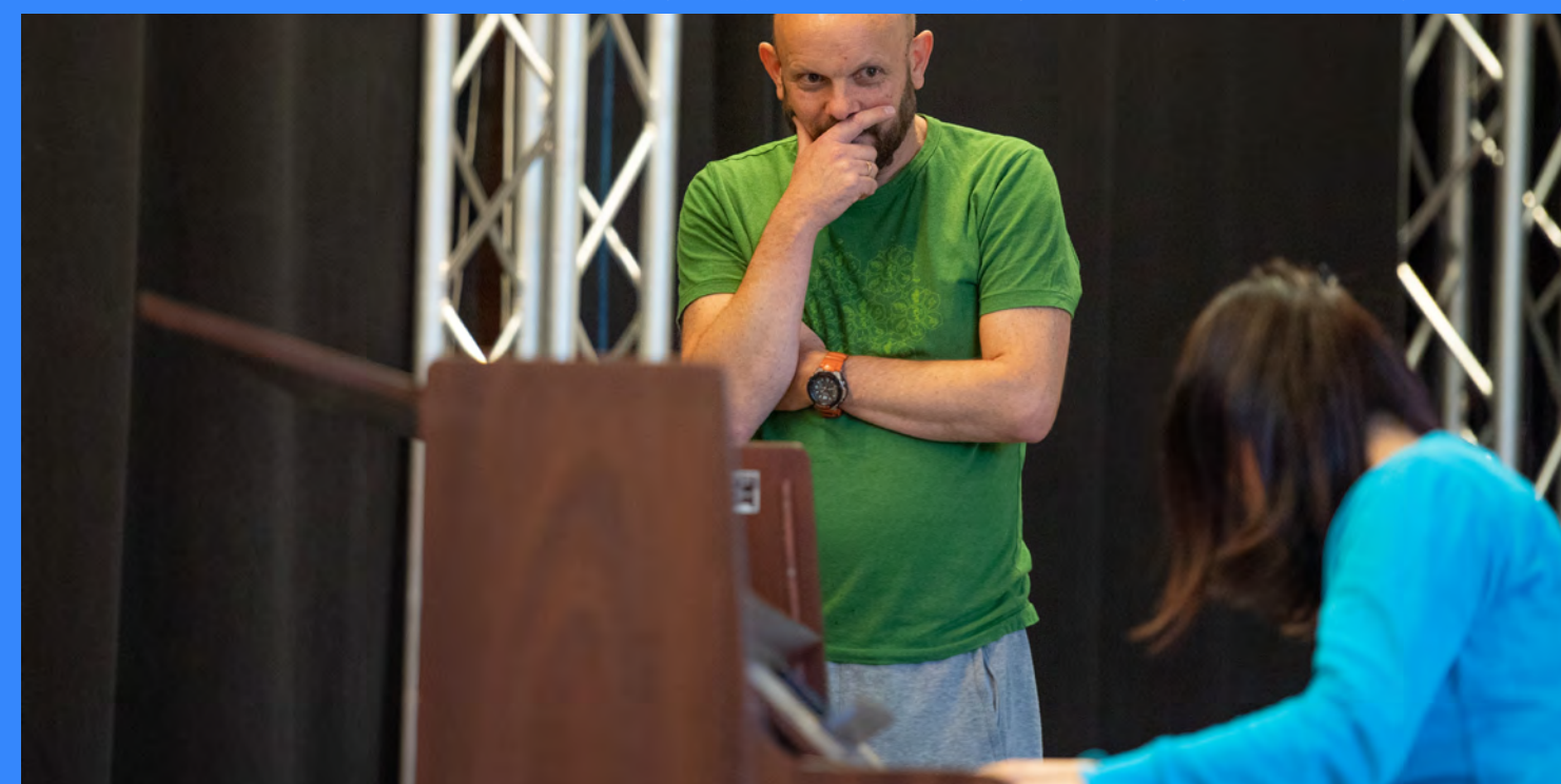
DiSko-prosjektet (Skole og konsert – fra formidling til dialog) inviterte til workshop for utøvarar med regissør og koreograf Struan Leslie.