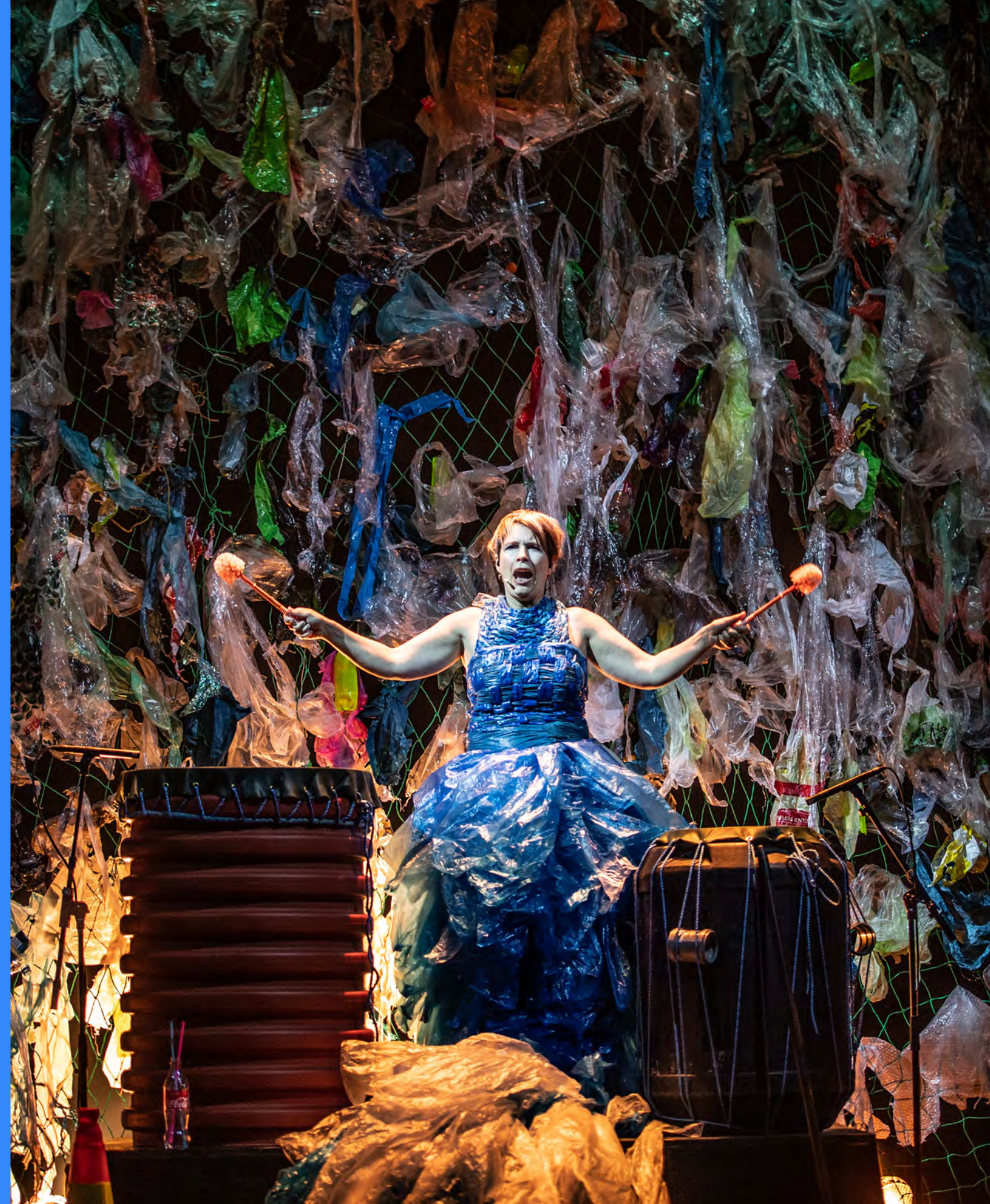
Sustain, ei konsertframsyning om forsøpling og mennesket sitt forhold til naturen – frå DKS Vestfolds framsyningsarena Marked for musikk i Larvik, oktober 2018.

Oppsett: Lars Opstad Framsidedfoto: Dansar Abir Alyousofi, frå Teater Innlandets danseframsyning Hello , regi/koreografi: Therese Slob. Biletet er teke under Scenekunstbrukets framsyningsarena Showbox, desember 2018.