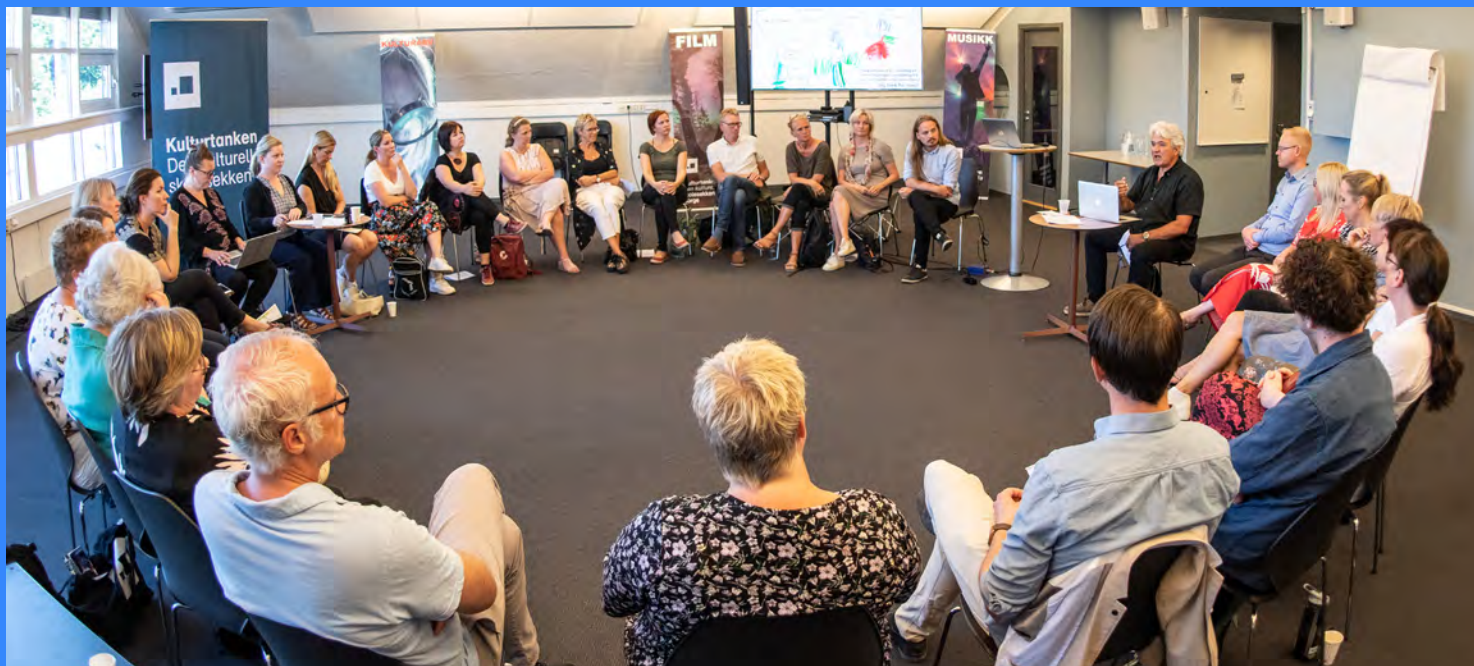
SAMTALAR. I haust deltok over 70 personar på heildagssamtalar om fagområda scenekunst og visuell kunst i Den kulturelle skulesekken (DKS).