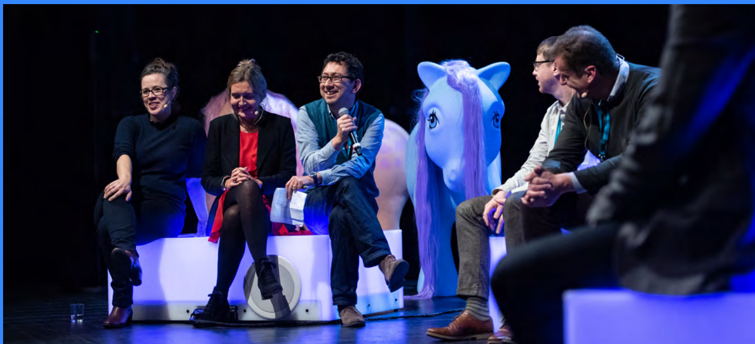
KVALITET. FoU-konferansen Kvalitet i kunst og kultur til barn og unge gjekk av stabelen i november, med gjestar frå mellom anna Arts Council i England.