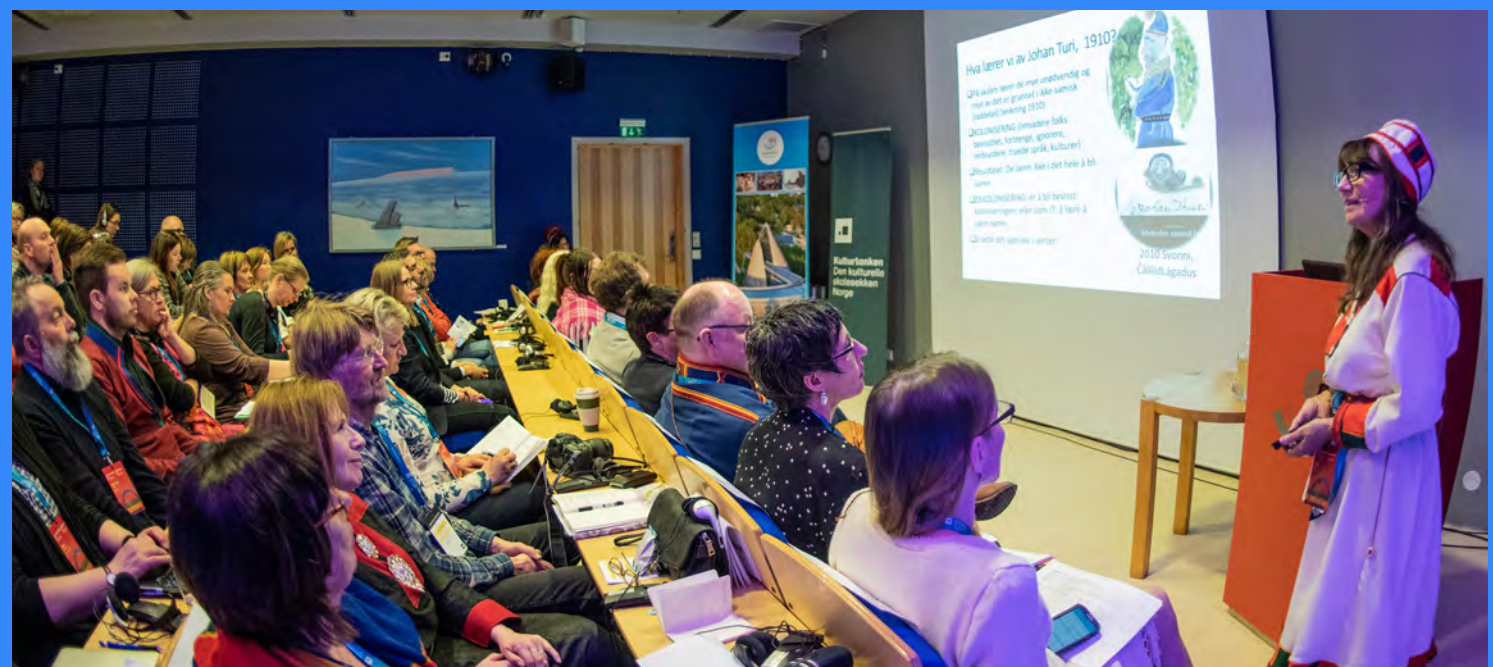
NASJONENS STEMME – konferanse på Sametinget i Karasjok markerte startskotet for fokus på samisk kunst og kultur i DKS.