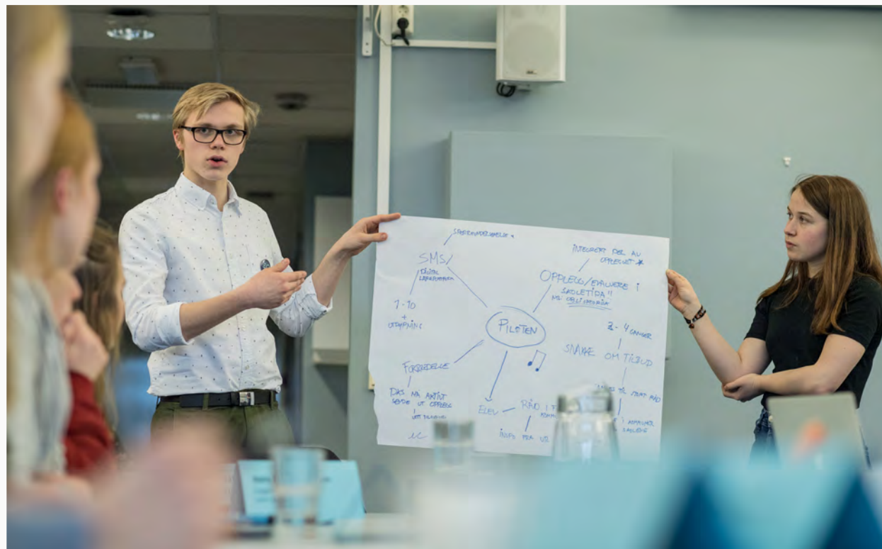
Det nyetablerte Ungdomsrådet i full sving under ein workshop i Kulturtankens KunstLab.

Ungdomsrådet har i 2018 hatt fire ordinære møte. I tillegg har delar av Ungdomsrådet hatt eit arbeidsmøte i tilknytning til konferansen om elevmedverknad i Bergen 7. september. Tre representantar frå Ungdomsrådet deltok og bidrog òg under konferansen om elevmedverknad i Bergen 26. og 27. september 2018. På møta har Ungdomsrådet arbeidd med elevmedverknad i Den kulturelle skulesekken og utarbeidd forslag til pilotar om elevmedverknad i DKS. Rådet har òg arbeidd med og førebudd si eiga involvering i konferansen om elevmedverknad, gitt tilbakemelding på tilskotsmottakarane sine forslag til pilotar på elevmedverknad i skuleprosjektet og gitt innspel til kulturarv og involvering i Arena kulturarv.