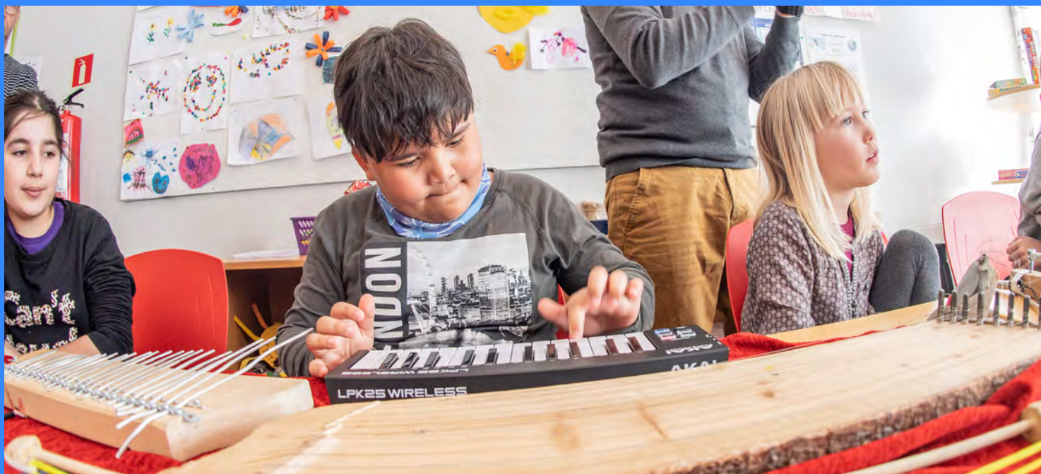
LYDLOFT – Drivhusets komposisjonsverkstad på turné i Finnmark.