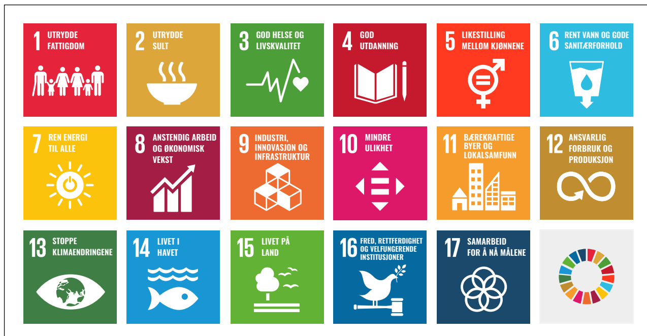
Figur 2.1 De 17 bærekraftsmålene