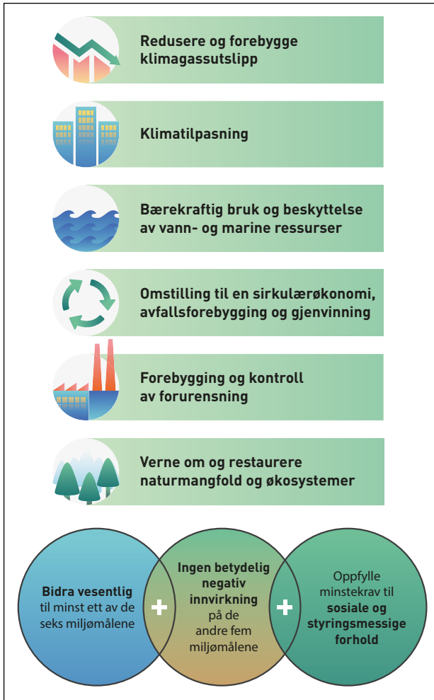
Figur 2.4 Oversikt over miljømål og vilkår i EUs taksonomi for bærekraftig økonomisk aktivitet

Kilder: EU-kommisjonen og Klima- og miljødepartementet