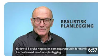
Realistisk planlegging - opplæring i plan for politikarar