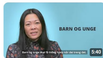
Barn og unge - opplæring i plan for politikarar