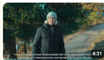
Korleis lukkast med planlegging? Opplæring for politikarar