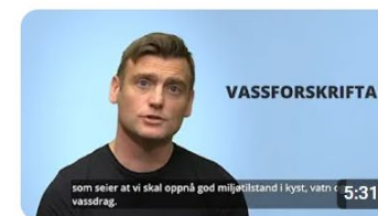
Vassforskrifta - for kommunepolitikarar