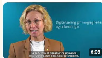
Utfordringsbildet - opplæring i plan for politikarar