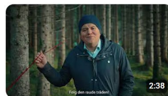
Fem gode grunнар til å planlegge. Opplæring for politikarar