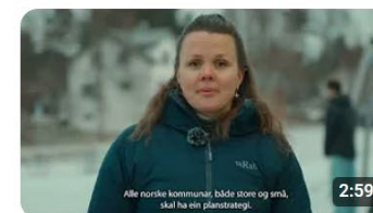
Kommunal planstrategi. Opplæring for politikarar