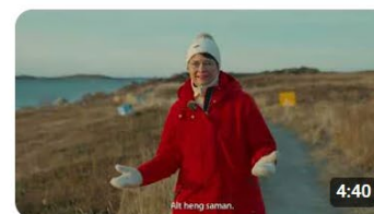
Korleis få berekraft inn i planlegginga? - Opplæring i plan f...