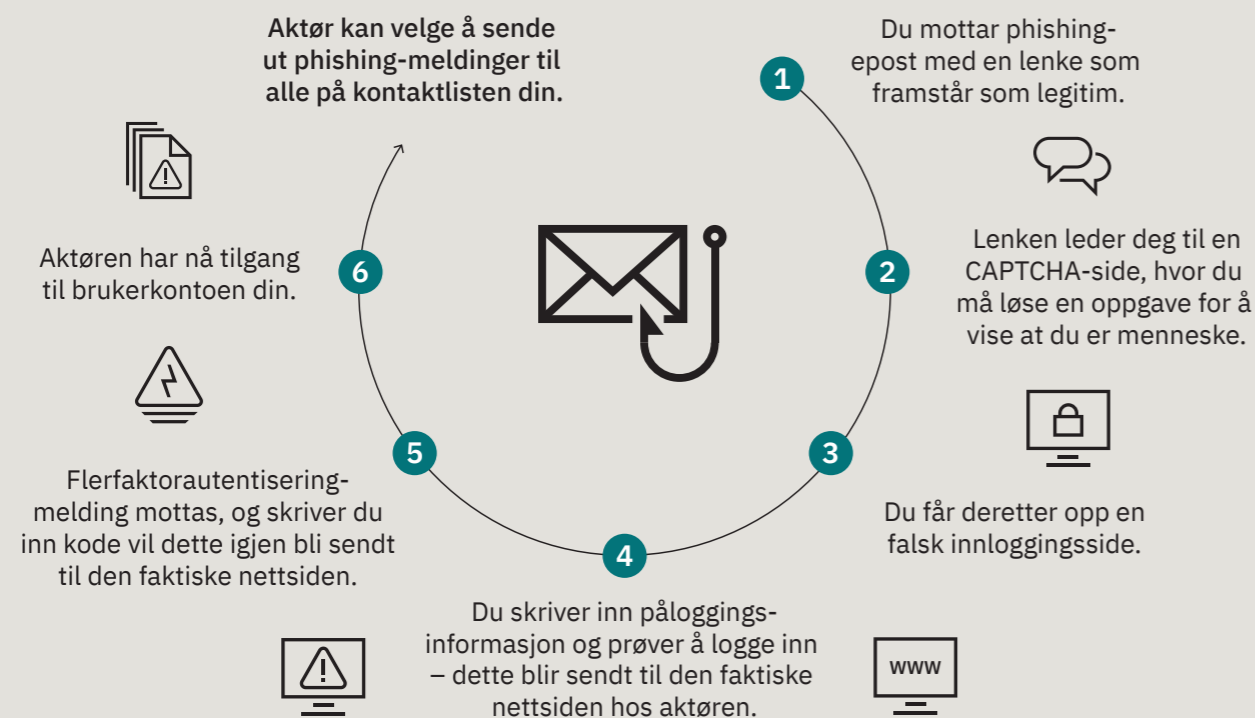
Figur 3: Hvordan ondsignede aktører bruker angriper-i-midten-phishing for å lure til seg innloggingsdetaljer og å komme seg forbi flerfaktoraутентisering.