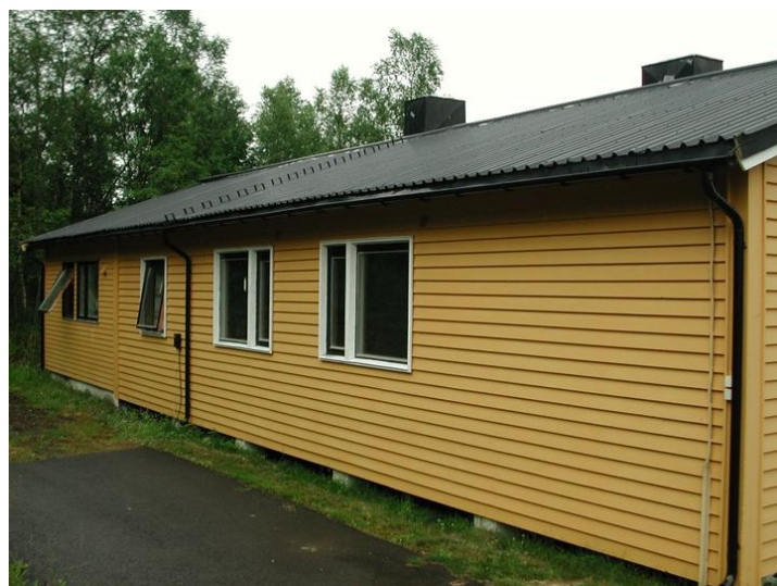
Fasade nord.