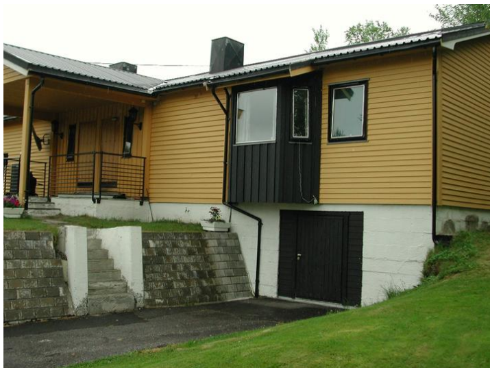
Fasade sør.

Kompleks 383 GRENSEKONTROLLSTASJON STORSKOG