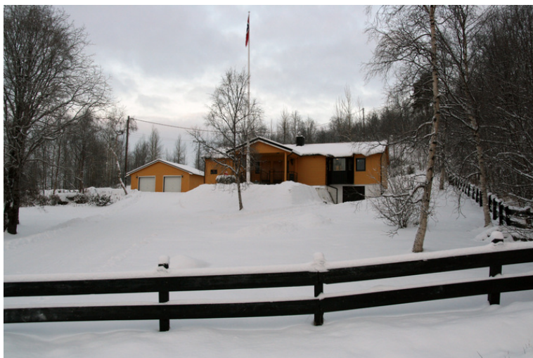
Grensekommisærers konferansehus.

Formål: Formålet er å bevare bygningen oppført for Den norske grensekommisærers konferanser med russiske myndigheter. Begrunnelse: Konferansehuset er og har vært møtesetet hvor de norske og russiske grensekommisærene har møttes for drøfting av grensepolitiske saker. Omfang: Eksteriør. Interiør: konferanserommet, stuen og kjøkkenet. Vernekategori: Verneklasse 2, bevaring