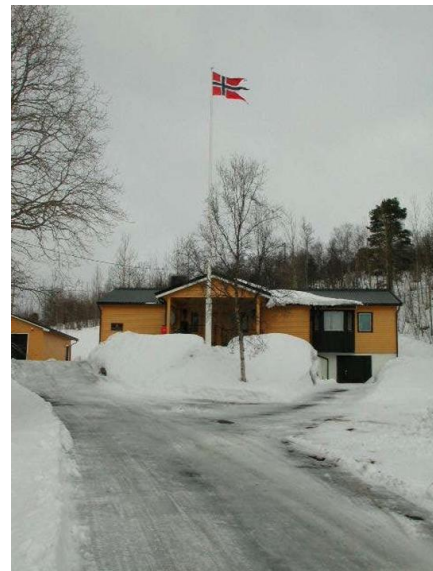
Konferansehuset sett fra sør med hovedbygningen midt i bildet og garasjen til venstre.