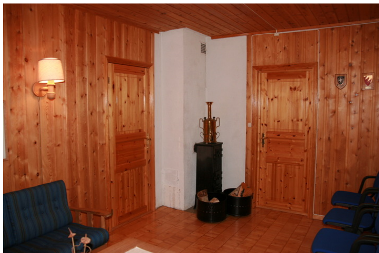
På ovnen i stua er det plassert en russisk samovar.