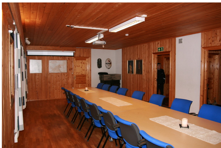
Konferanserommet med peis.