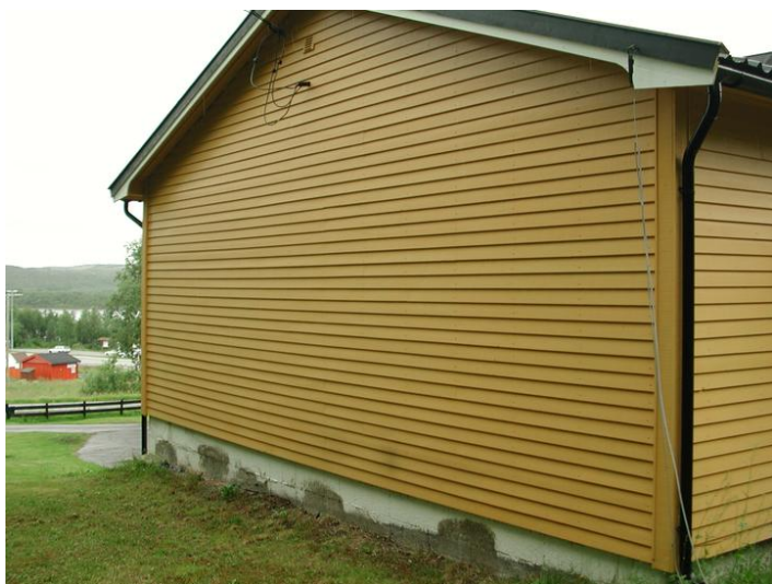
Fasade øst.