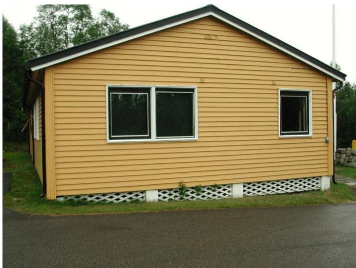
Fasade vest.