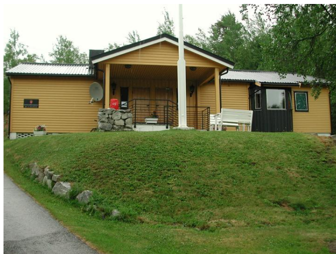
Oversiktsbilde sett fra sør.