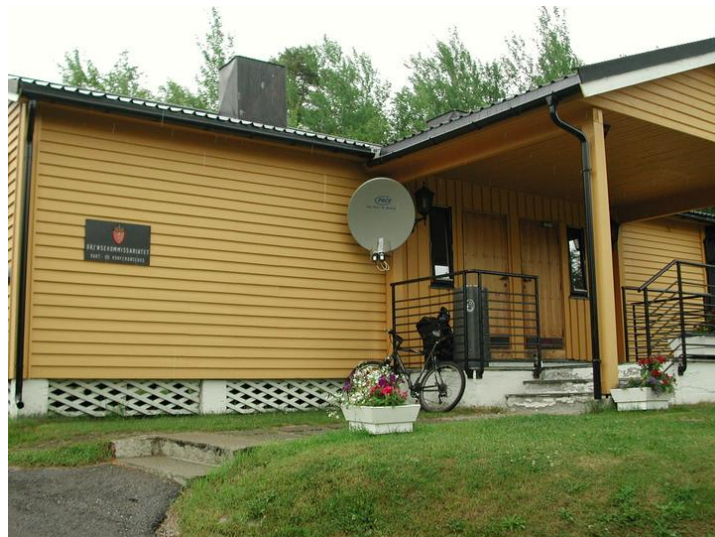
Fasade sør .