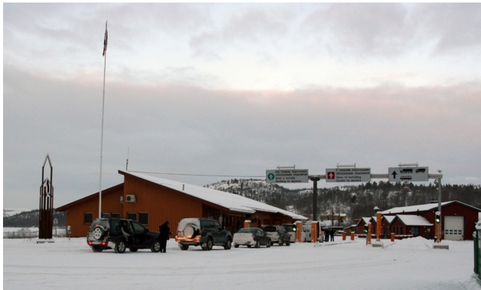
Storskog tollsted.