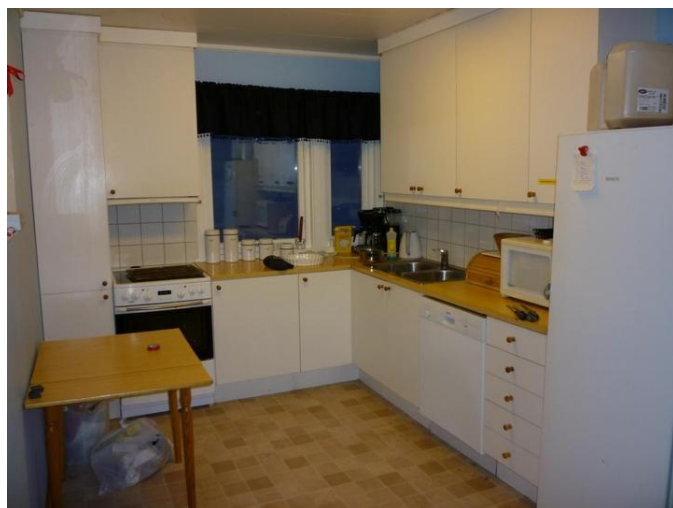
Kjøkkenet i konferansehuset.