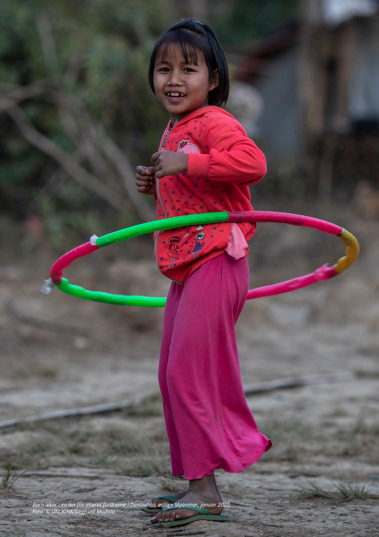
Barn leker i en leir for internt fordrevne i Dimawhso, østlige Myanmar, januar 2022.