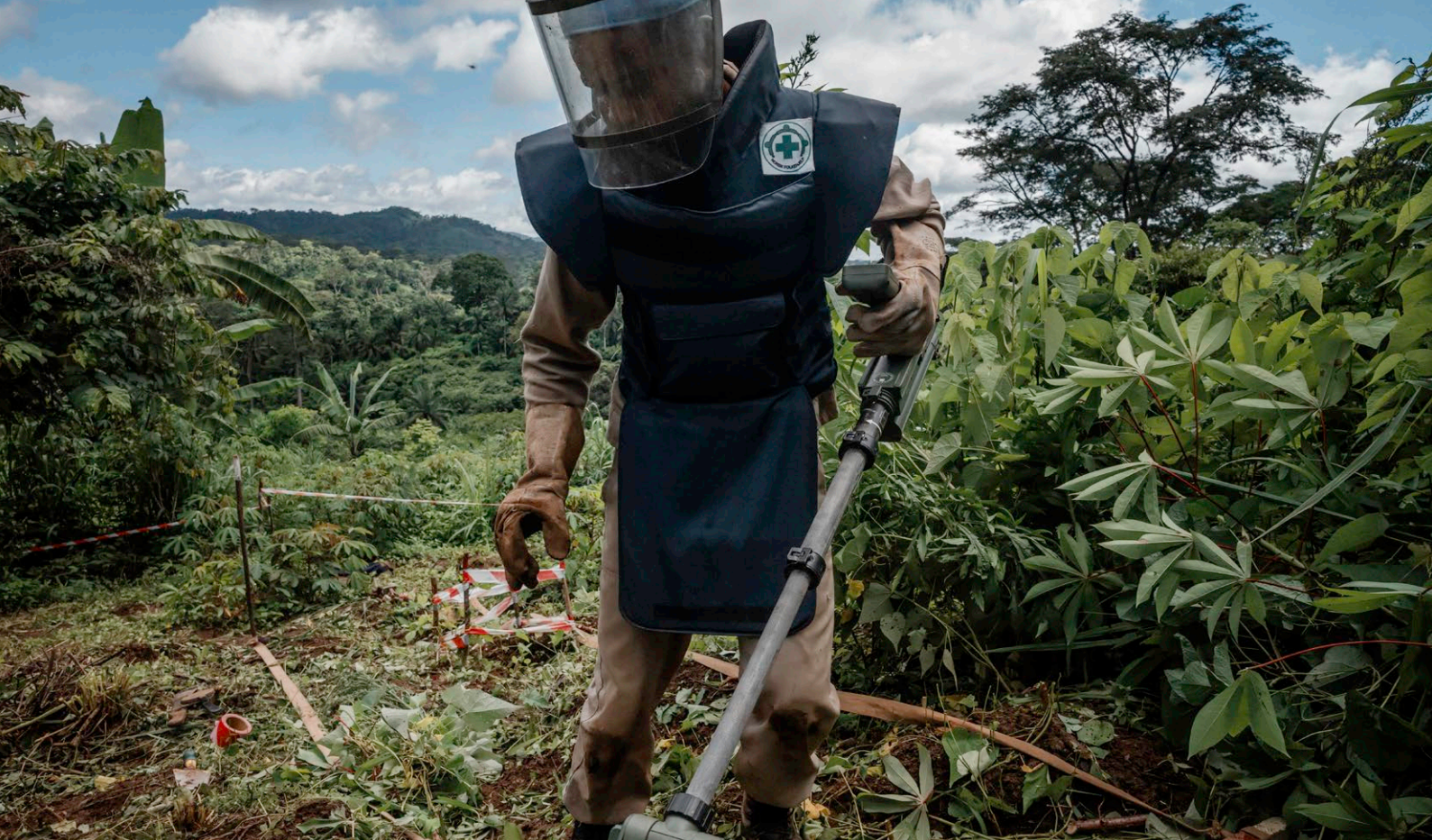
Minerydding pågår. Norsk Folkehjelp rydder et stort minefelt i Tula Sanji i Angola.