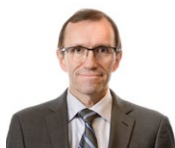
Espen Barth Eide Espen Barth Eide

Vi ønsker å takke alle organisasjonene som har bidratt med viktige innspill til Norges nye humanitære strategi.