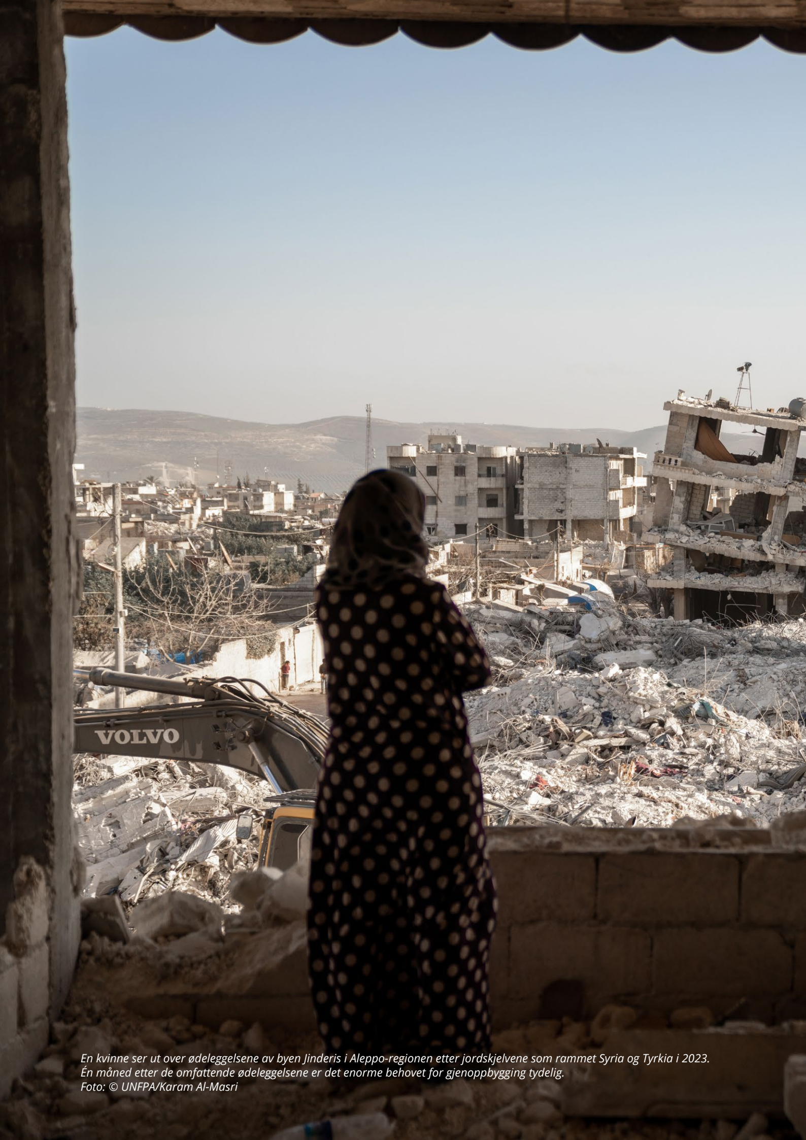
En kvinne ser ut over ødeleggelsene av byen Jinderis i Aleppo-regionen etter jordskjelvene som rammet Syria og Tyrkia i 2023. En måned etter de omfattende ødeleggelsene er det enorme behovet for gjenoppbygging tydelig.