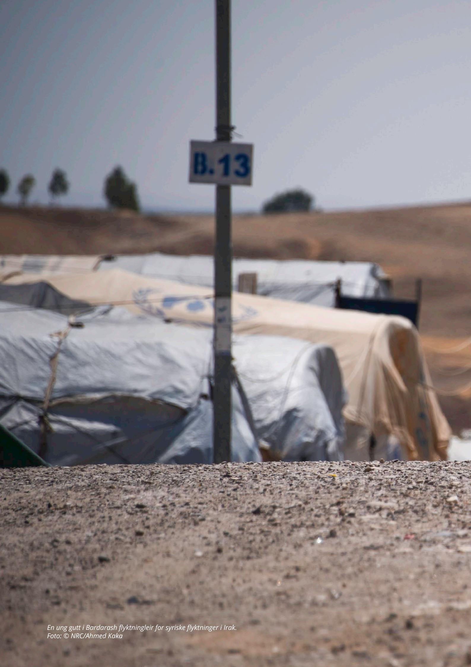
En ung gutt i Bardarash flyktningleir for syriske flyktninger i Irak.