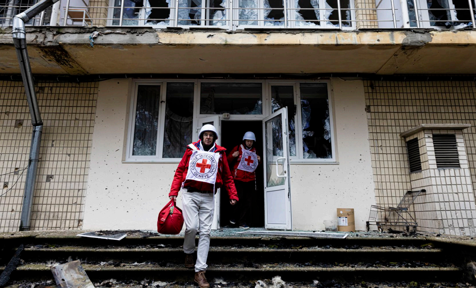
Militærsykehus i Irpin, nær hovedstaden Kyiv i Ukraina. Byen har vært åsted for harde kamper. Sykehuset er tomt og har fått store skader. ICRC gjennomfører et oppdrag for å vurdere behovene, yte førstehjelp og dele ut mat til menneskene som ble værende i byen.