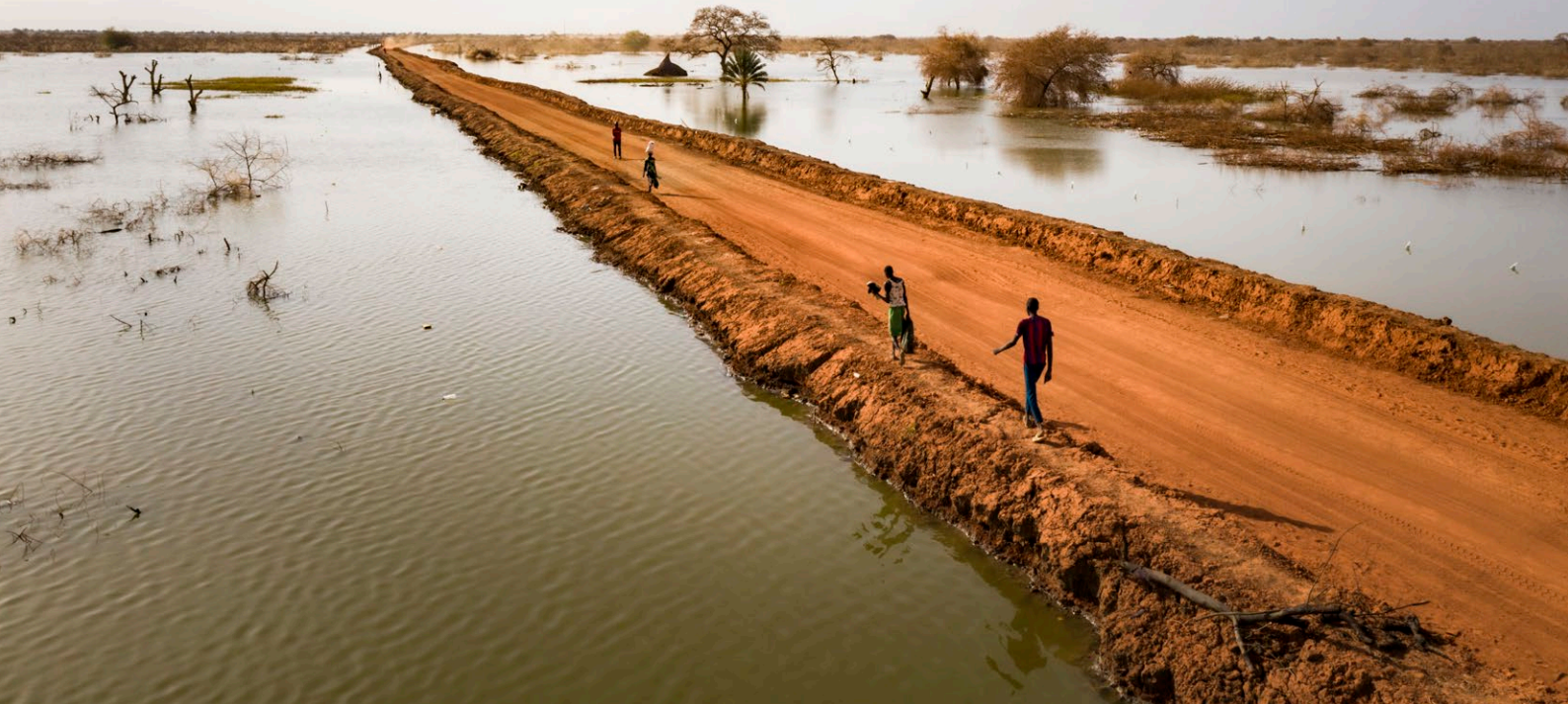
Tusenvis er fordrevet etter flere år med flom og oversvømmelser i Bentiu i Sør-Sudan. Denne veien er beskyttet av diker og skjærer gjennom flomvannet. Veien strekker seg helt til horisonten i nærheten av Bentiu.