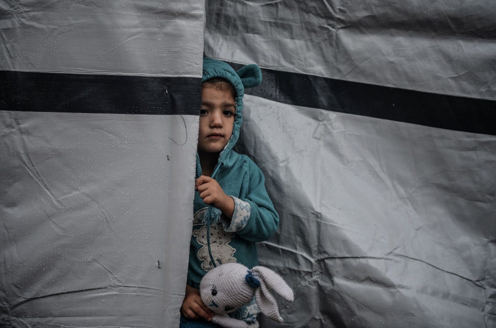
Hverdagslivet i Khan Younis i Gaza i november 2023.