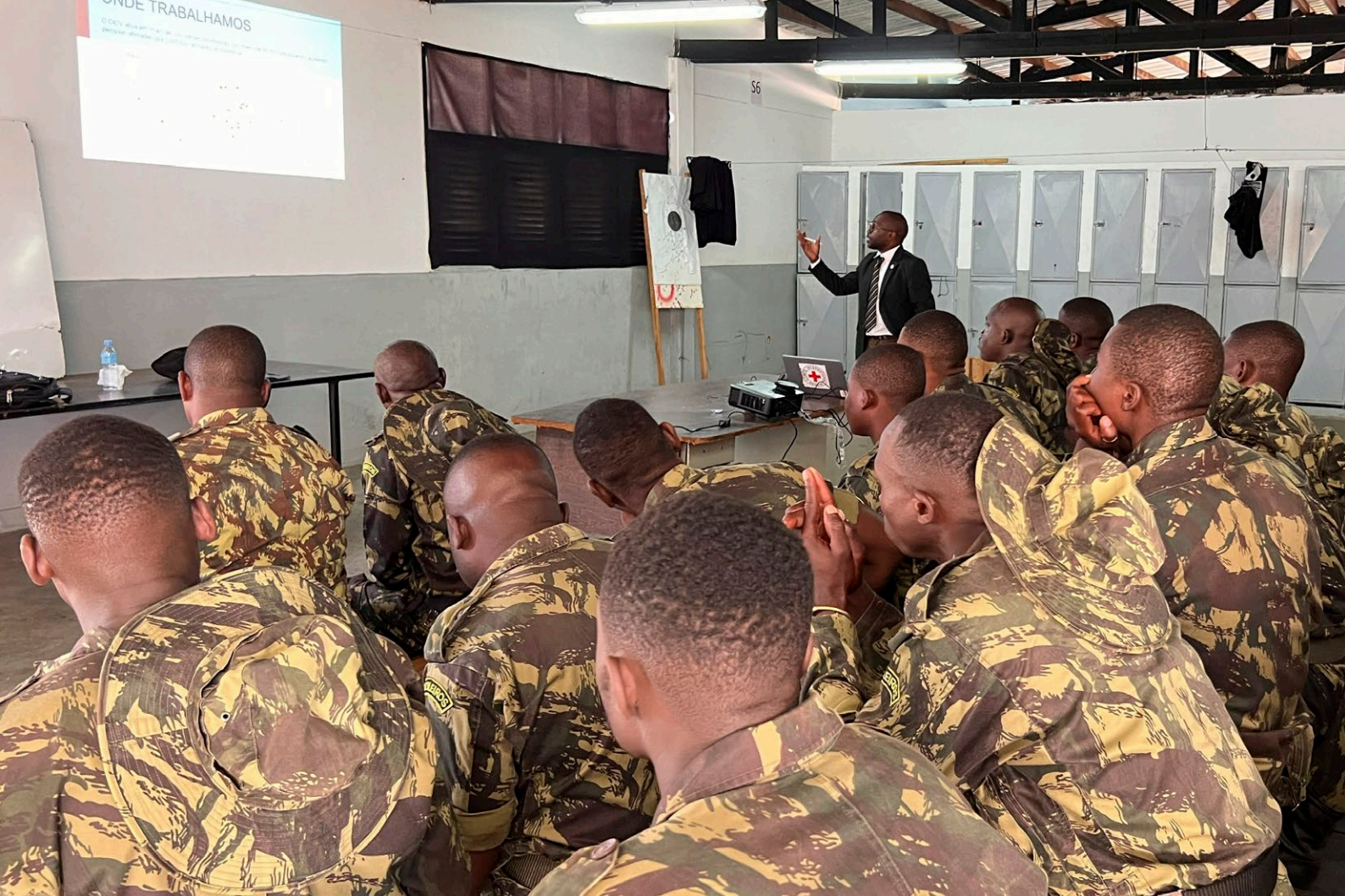
ICRC gir opplæring i humanitærretten til soldater i Mosambiks forsvarsstyrker.