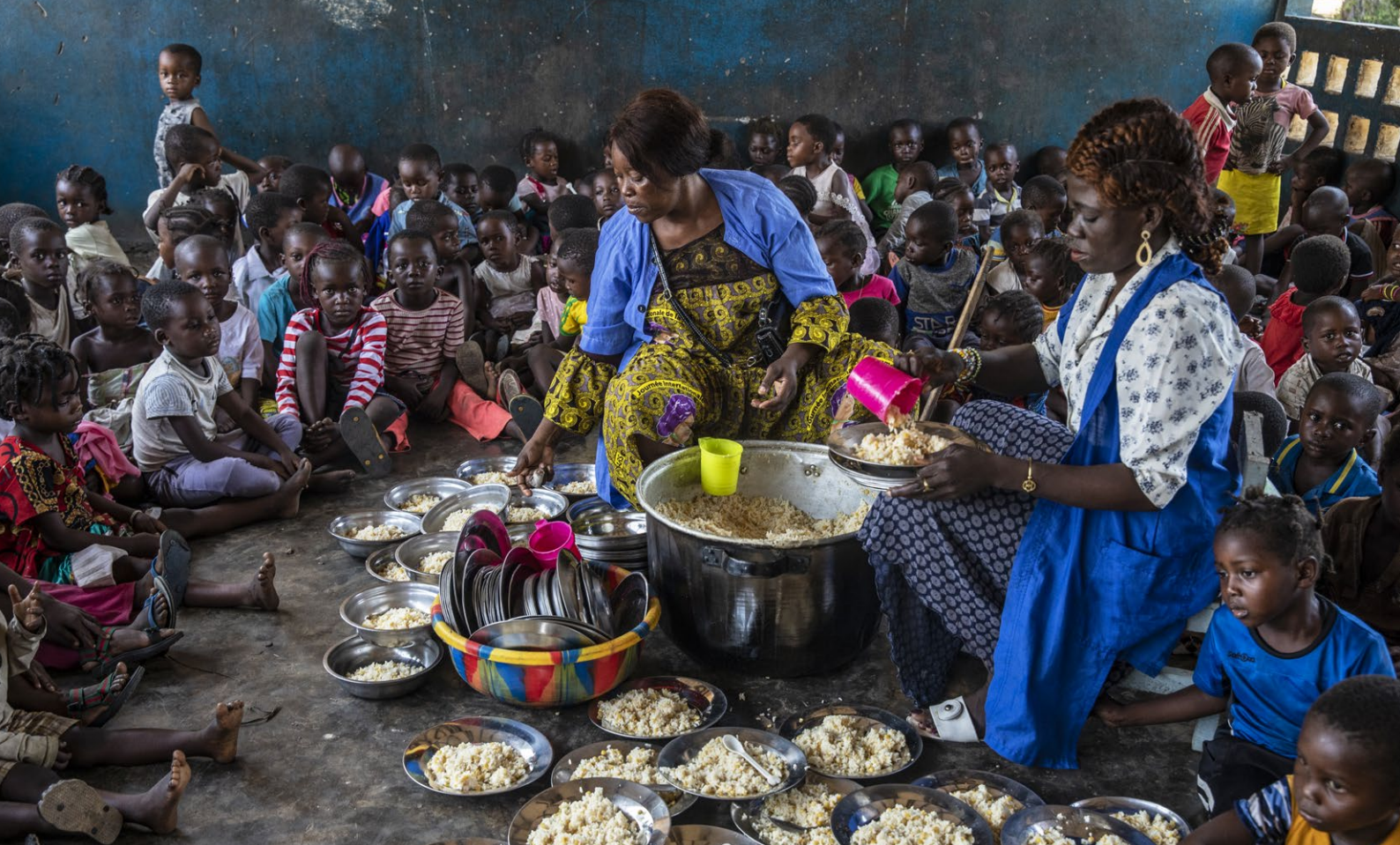
Lunsj og skolemat på Bouemba skole i Den demokratiske republikken Kongo (DR Kongo). Med støtte fra WFP får over 170 000 barn på over 500 skoler et næringsrikt måltid hver skoledag. Prosjektet er en del av WFPs arbeid med helhetlig innsats med mål om styrket matsikkerhet og økt skoledeltakelse blant sårbare grupper i DR Kongo.