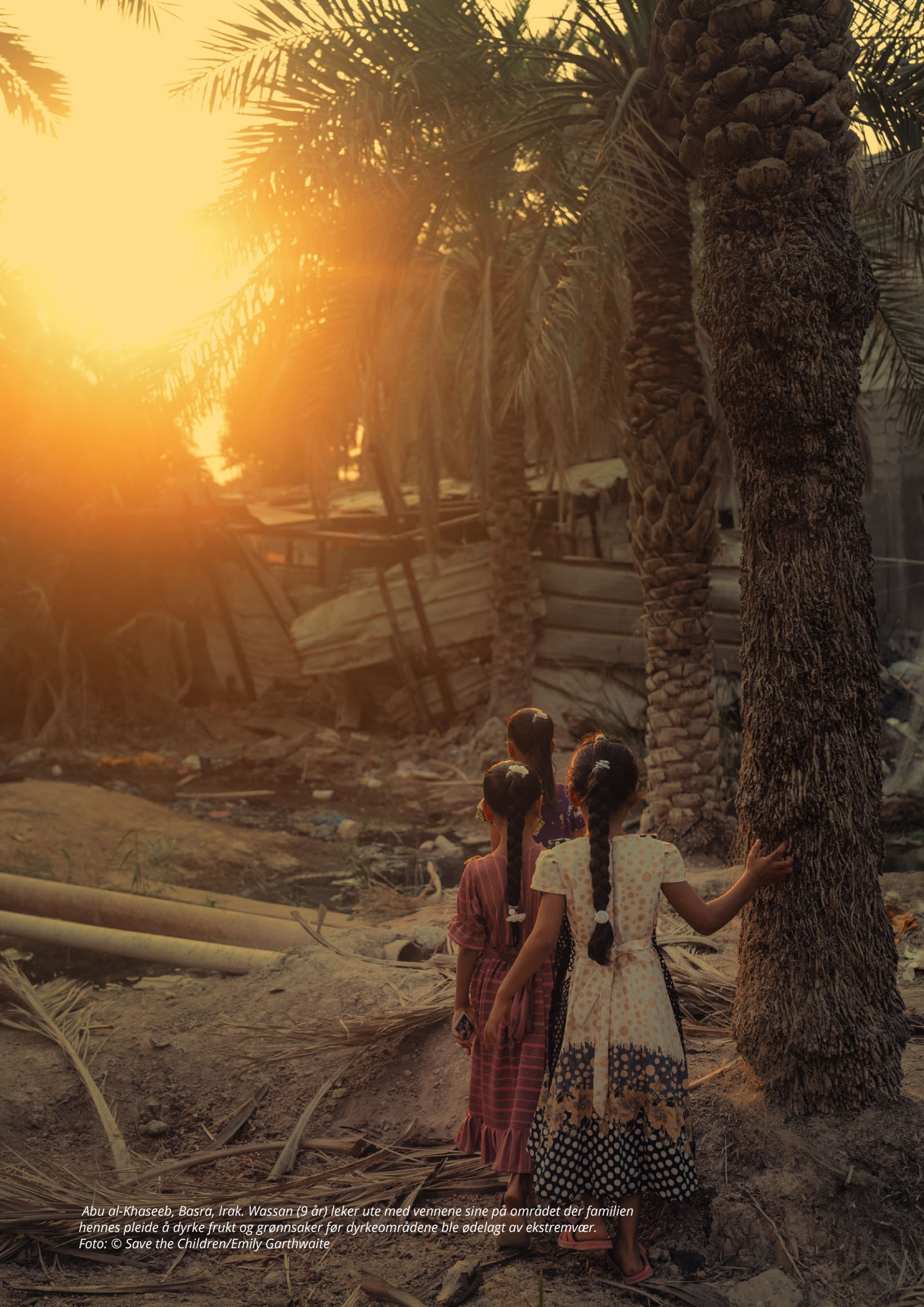
Abu al-Khaseeb, Basra, Irak. Wassan (9 år) leker ute med vennene sine på området der familien hennes pleide å dyrke frukt og grønnsaker før dyrkeområdene ble ødelagt av ekstremvær.