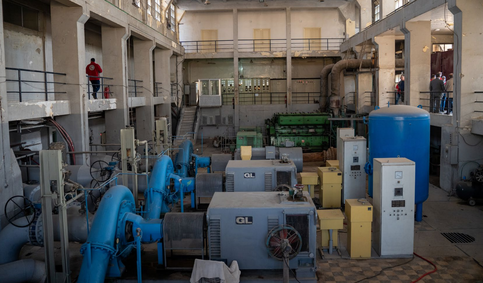
Aleppo, Syria, desember 2022. Pumpestasjonen Karam El Jablal i Aleppo by, sørger for at vannet kommer inn til byen fra vannkilden som ligger 90 kilometer lenger unna.