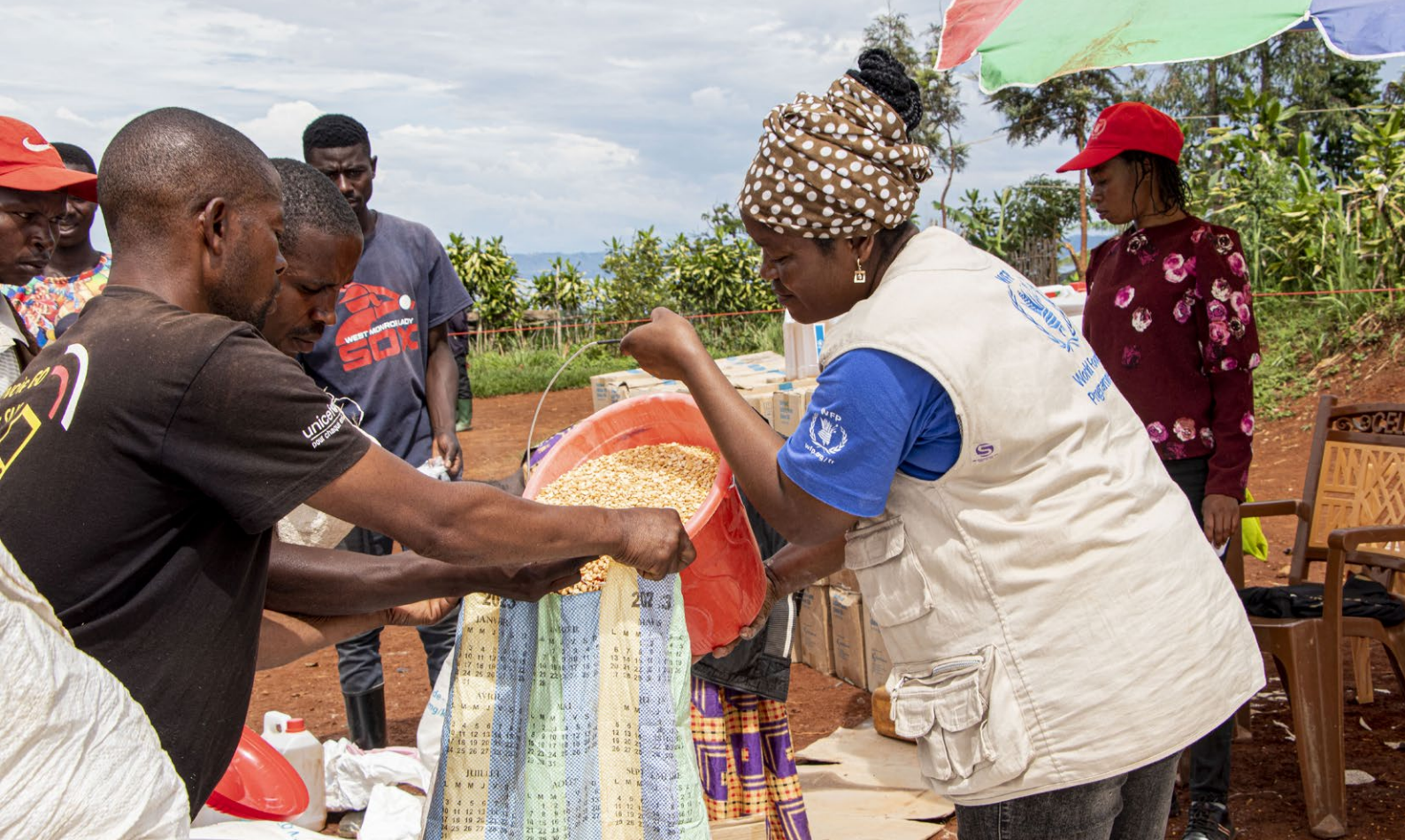
WFP støtter ofre for brann og flom i Kalehe, Sør-Kivu i Den demokratiske republikken Kongo.