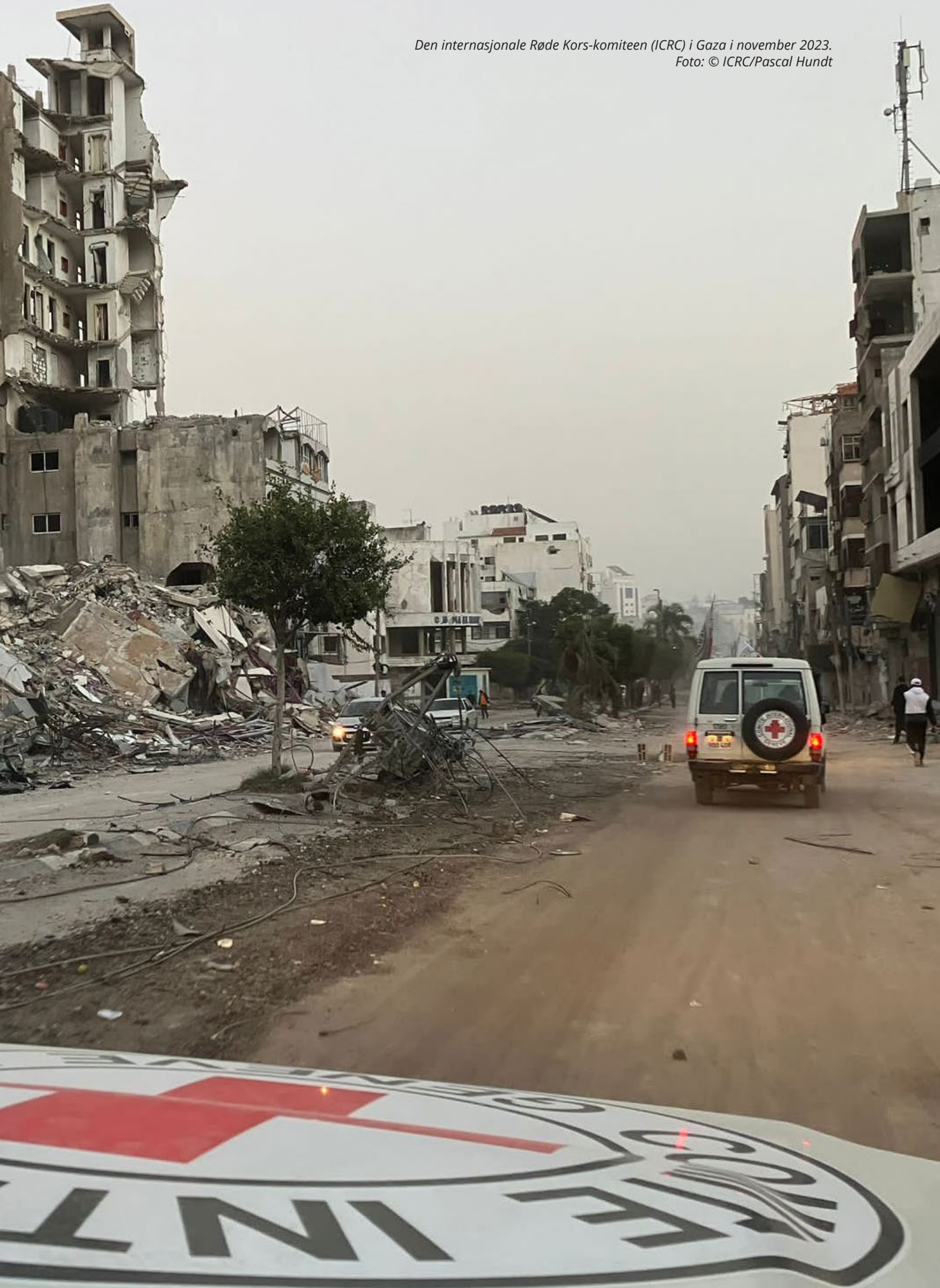
Den internasjonale Røde Kors-komiteen (ICRC) i Gaza i november 2023.