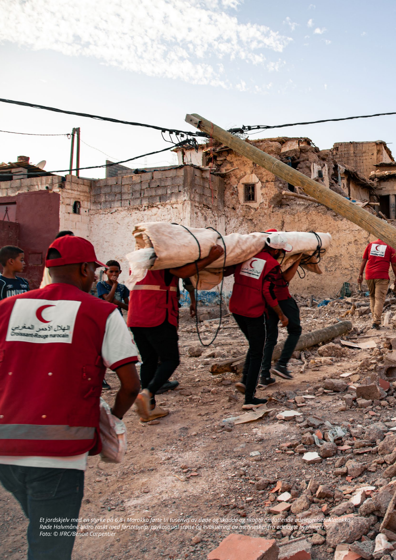
Et jordskjelv med en styrke på 6,8 i Marokko førte til tusenvis av døde og skadde og skapte omfattende ødeleggelser. Marokko Røde Halvmåne bidro raskt med førstehjelp, psykososial støtte og evakuering av mennesker fra ødelagte bygninger.