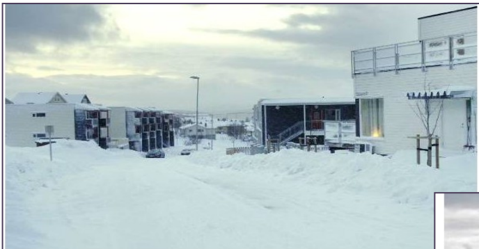
Tromsø blir det nye Drammen, ifølge boligekspertene.