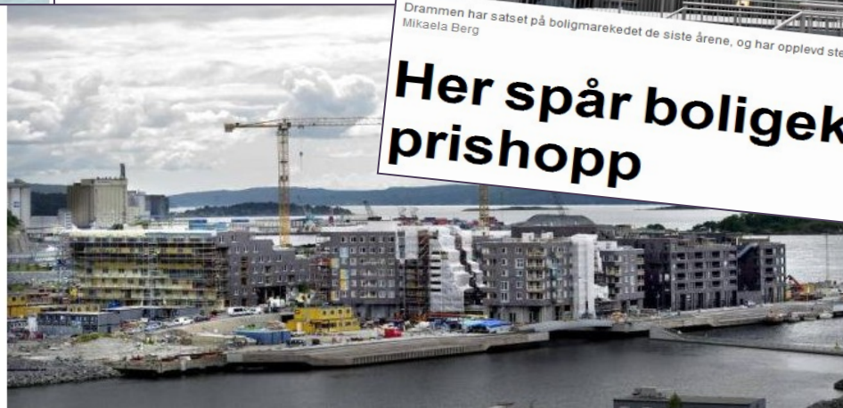
Serenga er et av flere nye og populære boligprosjekter i Oslo.