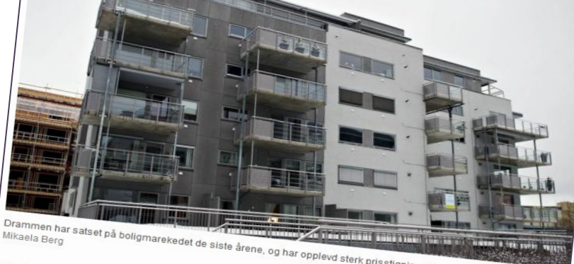
Drammen har satsset på boligmarkedet de siste årene, og har opplevd sterk prisstigning. Som er ventet å fortsette.

Boligprisene i Norge er nå dobbelt så høye som da vi rundet årtusenskiiftet. Denne byen har spesielt stor prisfremgang.