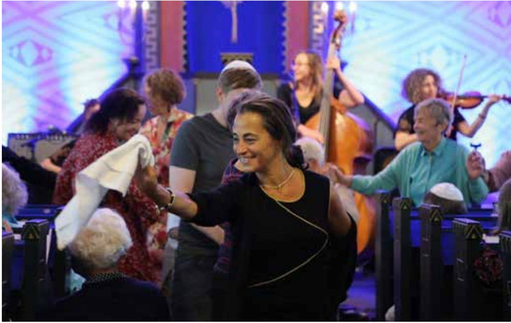
Jødisk kulturfestival i Trondheim.

Tiltak 6: Styrke tilskuddsordningen mot rasisme, diskriminering og hatefulle ytringer Ansvarlig: Kultur- og likestillingsdepartementet