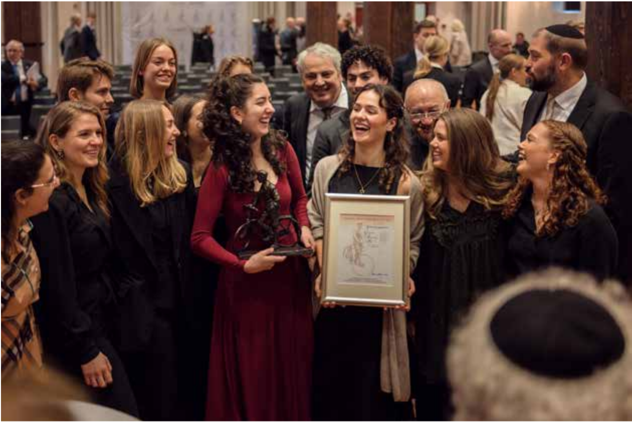
De jødiske veiviserne ble tildelt Sønstebyprisen i 2024.

Den norske kirke ser på holdninger i egne rekker. I april 2024 mottok kirken utredningen Den norske kirke i møte med jødedom og jøder, som den nå har til behandling.