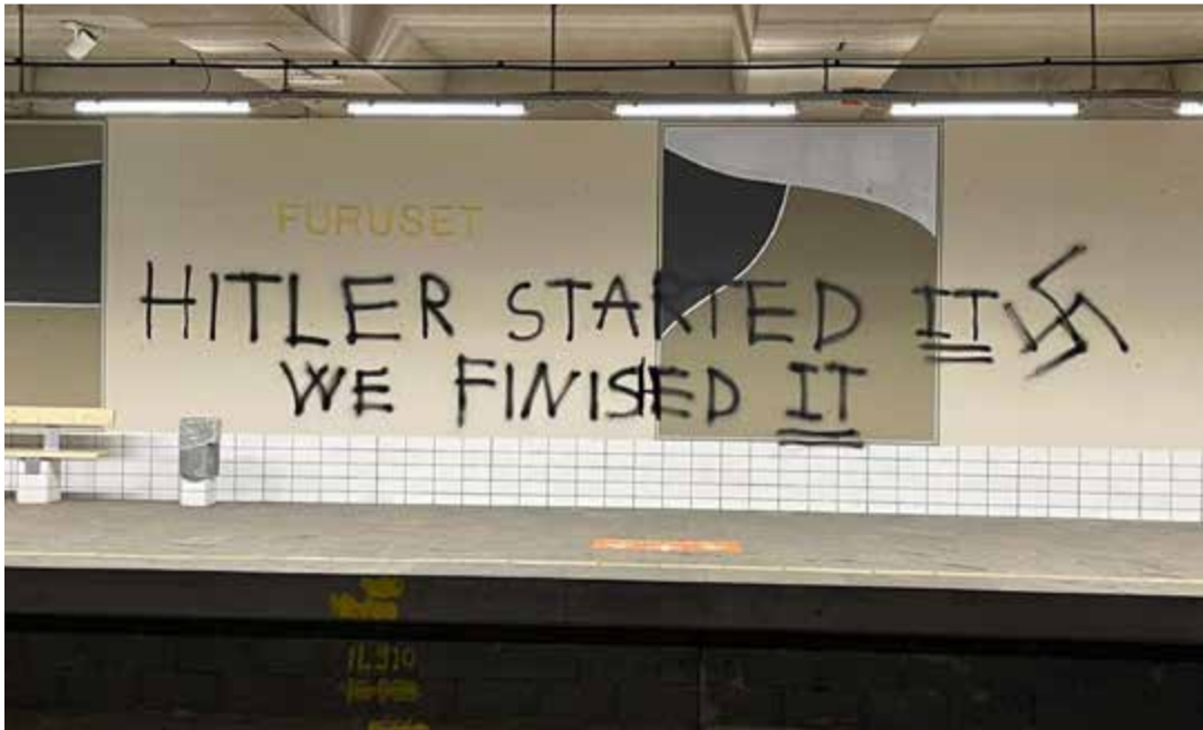
Tagging på Furuset t-banestasjon, desember 2023.

Antisemittisme er en bestemt oppfatning av jøder og kan komme til uttrykk som hat mot jøder. Språklige og fysiske former for antisemittisme rettes mot jødiske og ikke-jødiske enkeltpersoner og/eller deres eiendom, og mot jødiske institusjoner og religiøse samlingssteder.