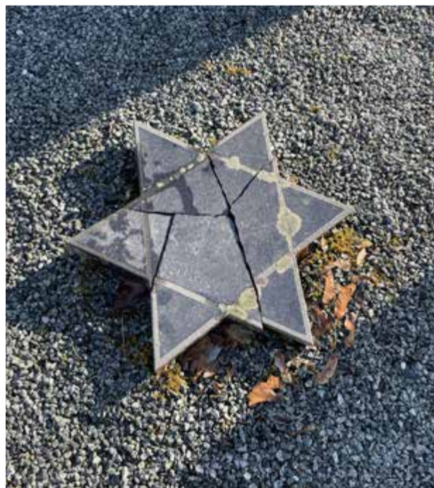
Hærverk på den jødiske gravlunden i Trondheim.

Jødisk kulturfestival Trondheim arrangeres årlig og er et viktig utadrettet kulturtiltak som synliggjør og får fram bredden i jødisk kultur for et allment publikum, og er også et bidrag til å motvirke antisemittisme. Det samme gjelder for utstillinger og aktiviteter ved de jødiske museene i Oslo og Trondheim.