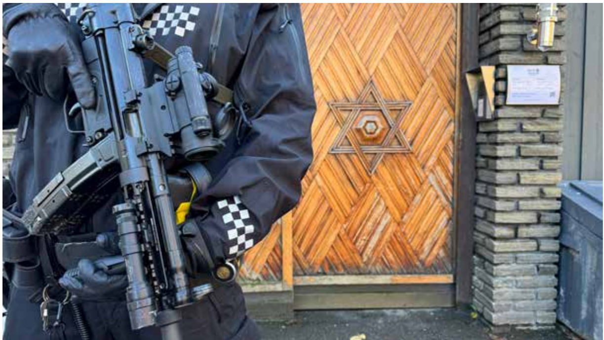
Væpnet politi utenfor synagogen i Trondheim.

trygghet for grupper som er særlig utsatt for trusler. PST utarbeider trusselvurderinger. Politiet vil vurdere iverksettelse av sikkerhetstiltak blant annet ved synagoger og andre møtesteder for det jødiske samfunnet, basert på det til enhver tid gjeldende trusselbildet og andre relevante forhold.