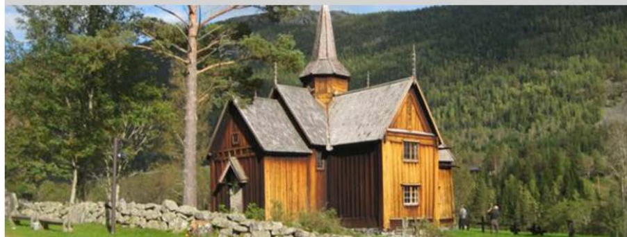
Nore stavkirke i Numedal.

Interaktivt kart - Kulturmiljøer i Buskerud