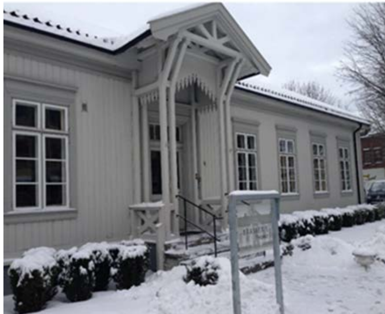
Tidligere fengsel, nå restaurant, Hønefoss