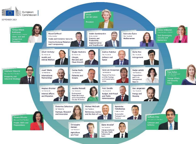
Den nylige presenterte Europakommisjonen.