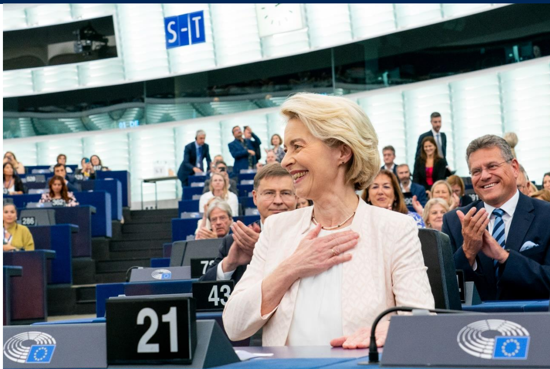
Ursula von der Leyen blir gjenvalgt som Kommissjonspresident.