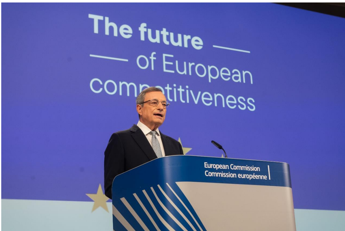
Mario Draghi presenterer sin rapport for Kommisjonen.