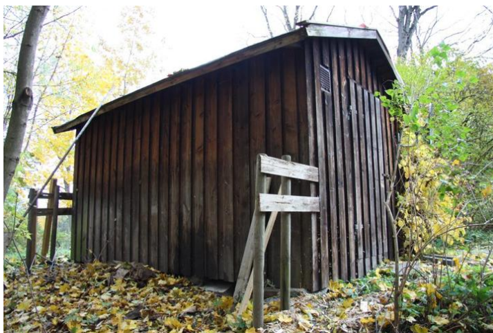
Uthus ved Thulstrupvillaen.