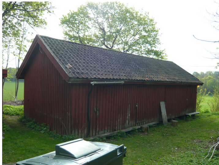
Gavlvegg mot nord.