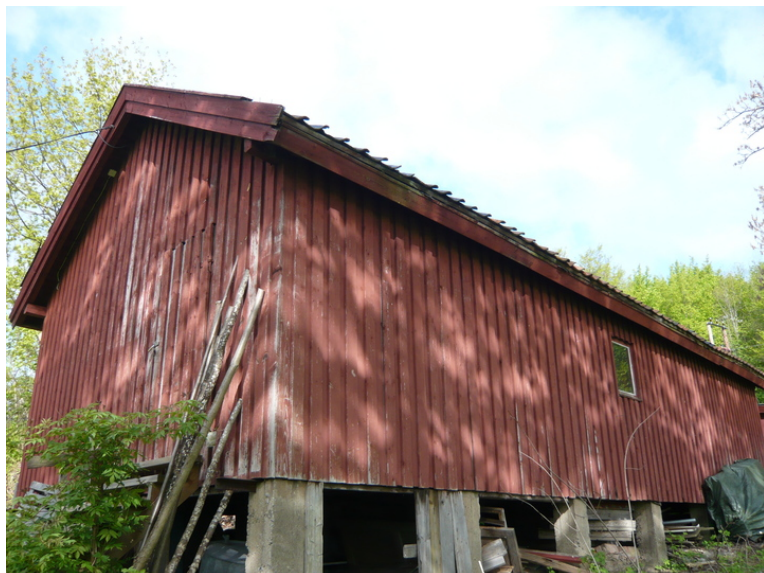
Langvegg mto øst.