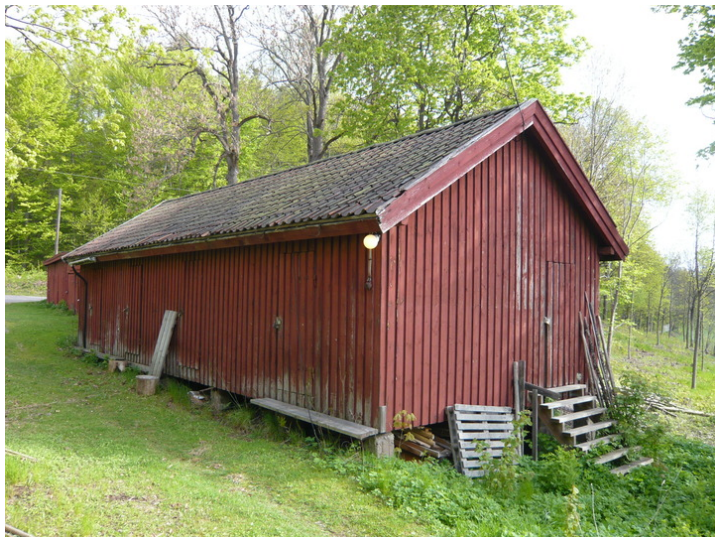
Uthuset ligger i forlengelse av garasjerekken ved Hengsengen.