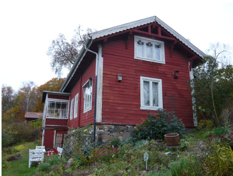
Fasader mot øst.