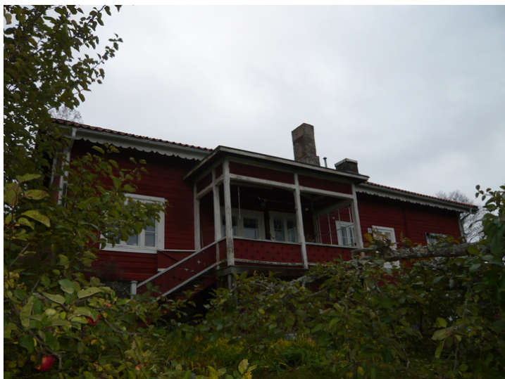
Fasade sør.