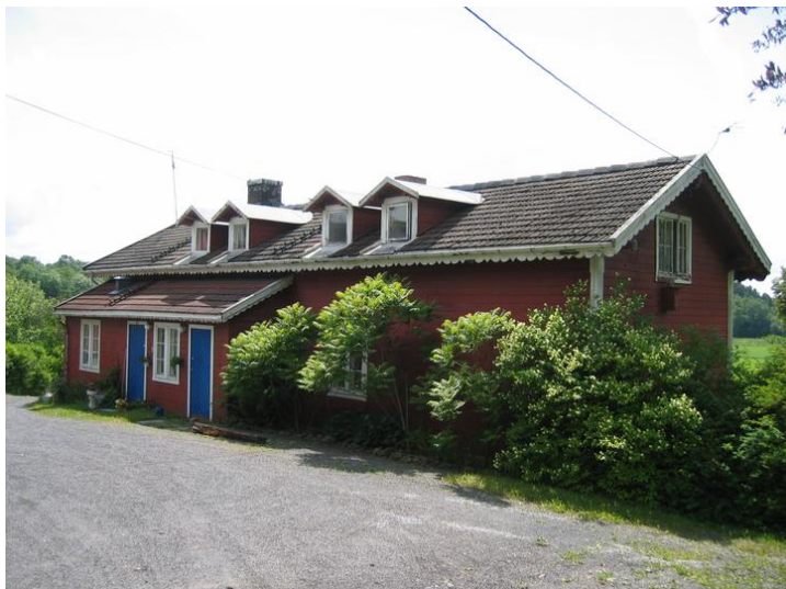
Fasade nord.