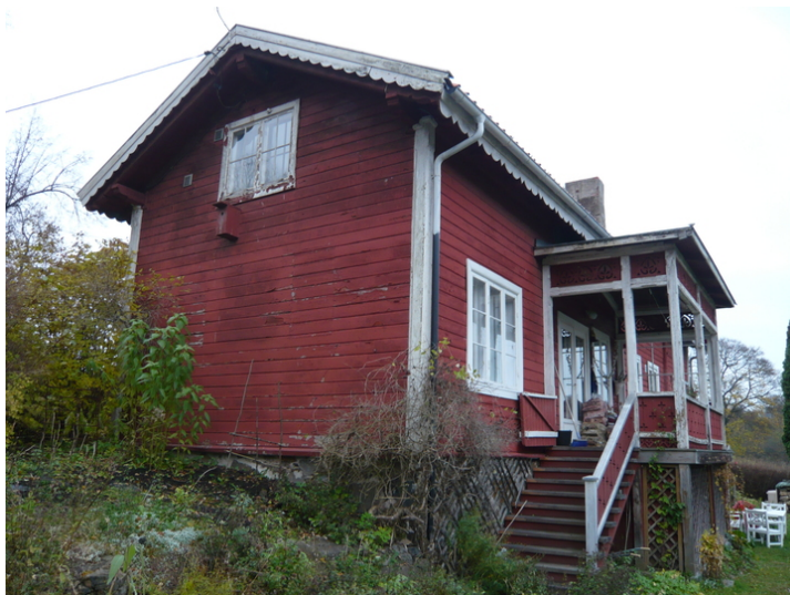
Fasader mot vest og sør.