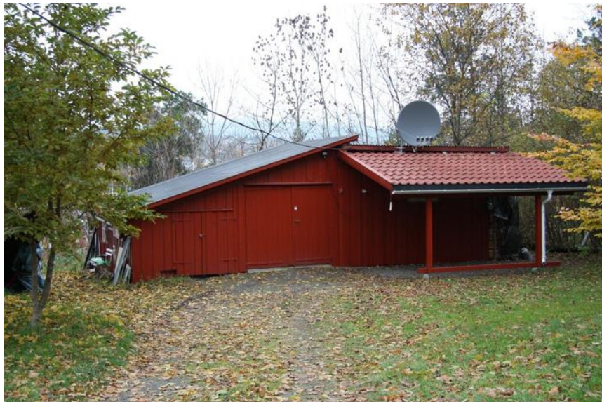
Uthuset til Hengsåsen. Carport, som er bygget på, har eget bygningsnummer.