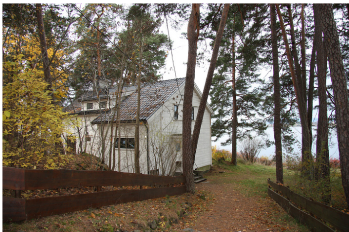
Villa GjØa med utsikt mot fjorden i vest.