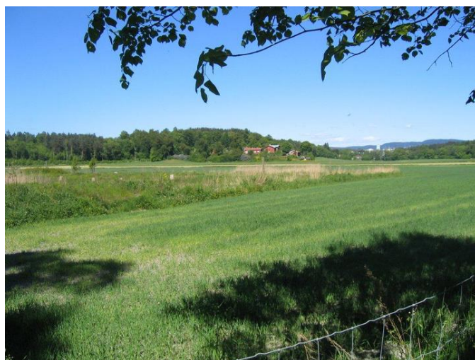
Boligmiljøet pØ den tidligere lØkkeeiendommen Hengsen midt i bildet.