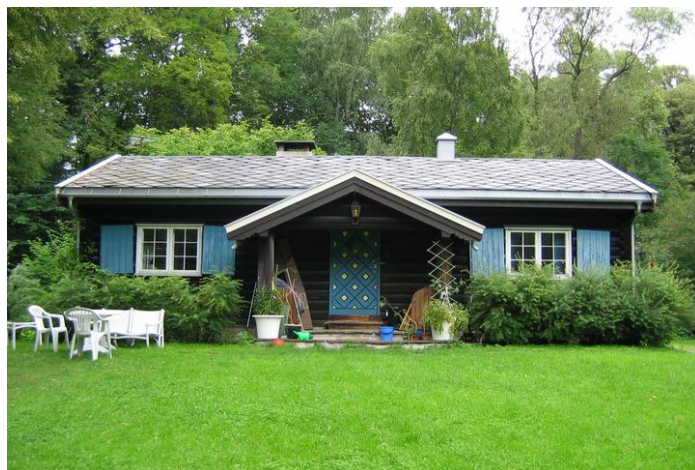
Bolighuset på Thulstrup.