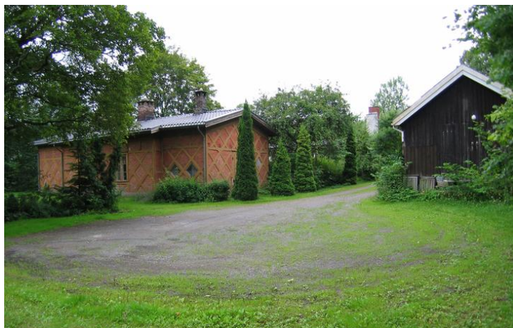
Gartnerbolig og uthus sett fra garasje (sett fra nord).