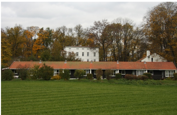
Den tidligere lØkkeeiendommen StrØmsborg med hovedbygningen midt i bildet og pensjonistbolig i forgrunnen.