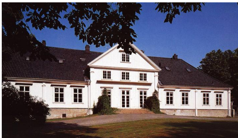
Hovedbygningen på kongsgården fra 1733. Denne og de andre bygningene som fortsatt disponeres av kongen er ikke omfattet av kulturmiljøfredningen.