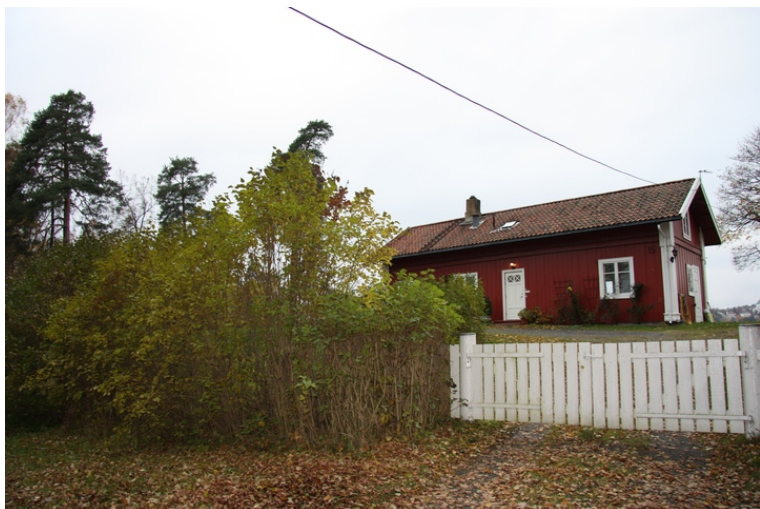
HengsØasen ligger nord pØ BygdØy med utsikt mot Bestumkilen. Bolighus fra rundt midten av 1800-tallet.