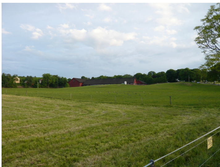
Noen av driftsbygningene pØ Øardstunet.