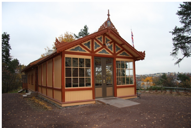
Seterhytten på Dronningberget. Her med utsikt mot vest, inn mot Oslo.