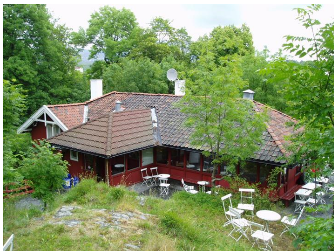
Rhodeløkken kafé og bolig.