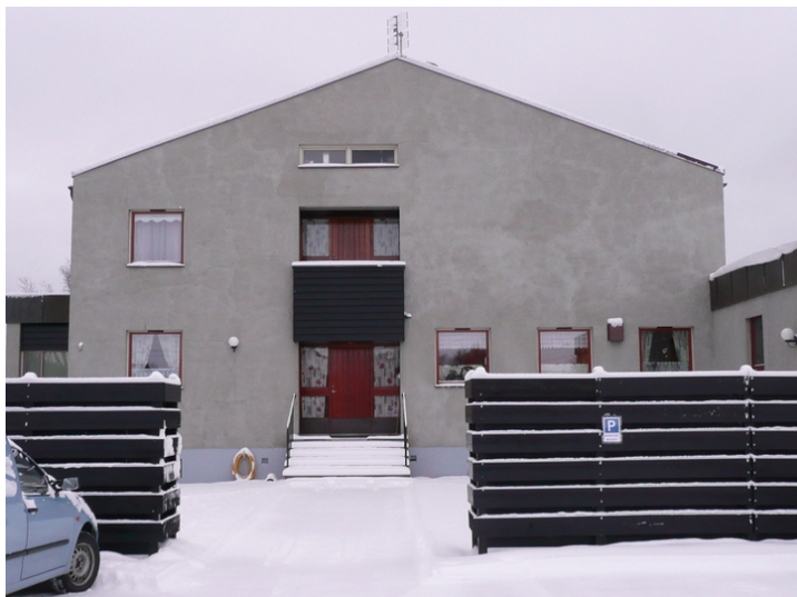
Fasade mot nord med den private inngangen. Vaktermesterboligen skimtes til høyre.