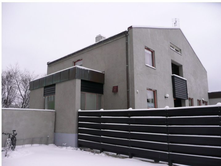
Fasader mot øst og nord. Gjerdet avgrenser parkeringsareal for Statens hus.