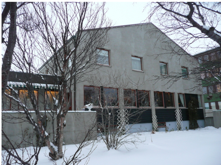
Fylkesmannsboligens representative rom ligger ut mot hagen i 1 etasje. Statens hus i bakgrunnen.