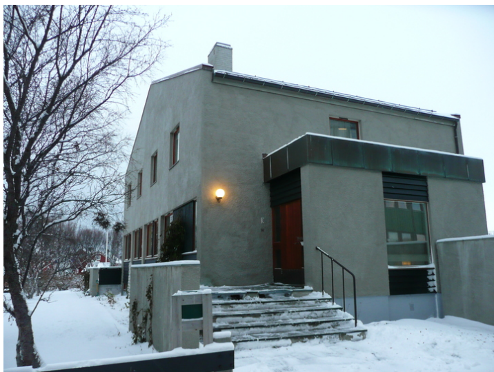
Fylkesmannsboligens representative hovedinngang.