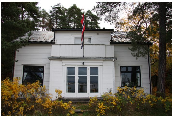
Fasaden i vest vender ut mot hagen og sjøen. Utstikket med veranda over er en del av den midterste stuen.