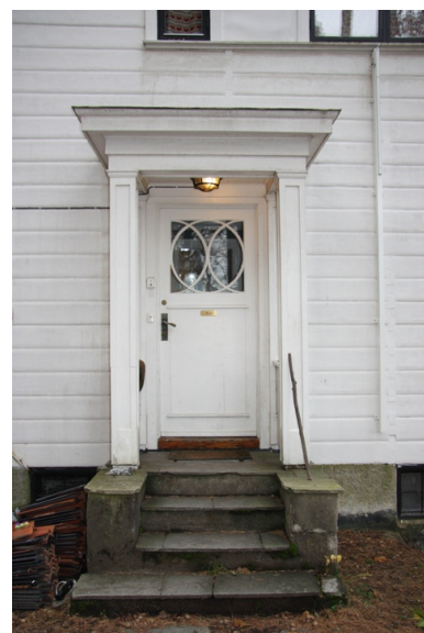
Hovedinngangsdøren har fine detaljer i art deco-stil.