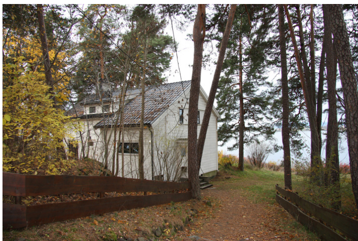
Villa GjØa ligger ved Paradisbukta med utsikt mot sjØen og var den siste i rekken av ialt seks losjihus oppført som betjeningsboliger av kong Oscar II.