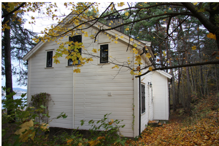
Fasade mot sør med inngang til kjelleren. Til venstre skimtes tilbygget fra 1935 som rommer trapp til annen etasje.