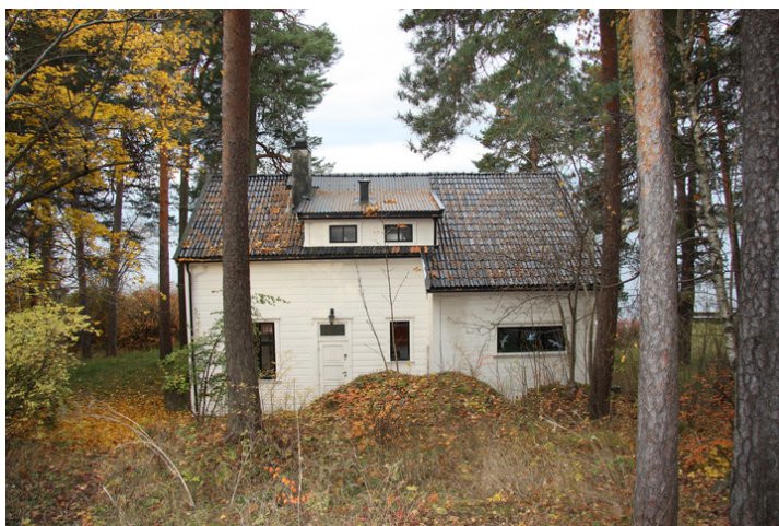
Inngangspartiet er på Østfasaden.