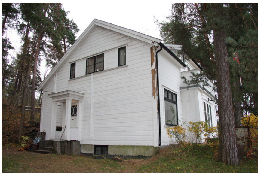
Hovedinngangen er på nordsiden.