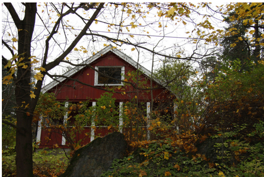
Fasade mot vest.