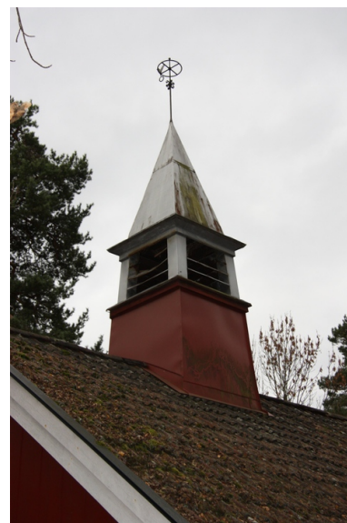
Tårnet på taket.