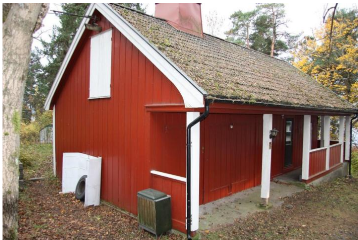
Fasade mot øst og nord. Garasjen er i østre del, mens boligdelen i vestre del har svalgang på to sider.