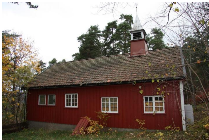
Fasade mot sør.