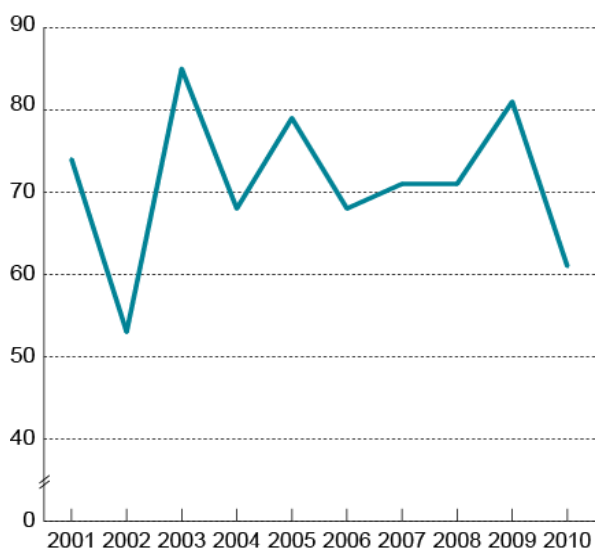
Figur 1.1 Lønnsgradningen som andel av total lønnsvekst fra 1. oktober til 1. oktober for industriarbeidere i NHO-bedrifter.