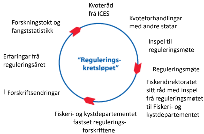
Figur 1: Reguleringskretsløpet

Figur 1 viser ”reguleringskretsløpet” som illustrerer korleis prosessen med fiskerireguleringar går føre seg gjennom året.