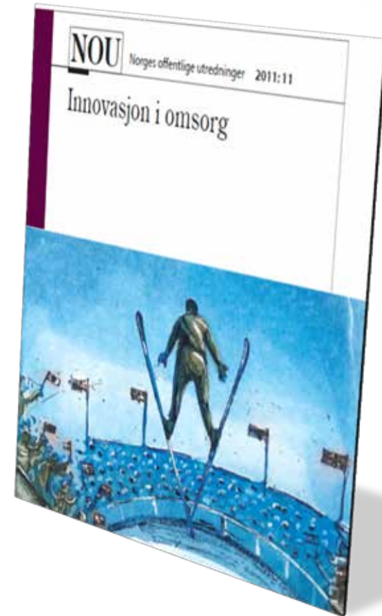
NOU 2011:11: Innovasjon i omsorg (juni 2011)

Trinn 3: Ta i bruk teknologi som stimulerer, underholder, aktiviserer og strukturerer hverdagen