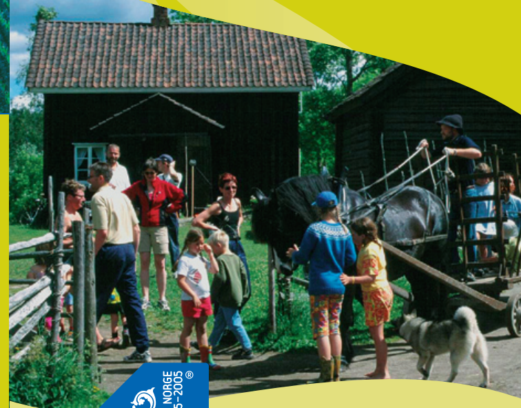
Illustrasjoner: Vidar Aaboen, Design: Unifonn AS