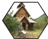
Kultur- og opplevelses- næring