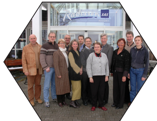
Utviklingsrådet på Beitostølen 4. november 2004.

Forutsetningen for en slik arbeidsform er at Innlandet 2010 får tildelt midler til hvert satsingsområde for gjennomføring. Dette vil mobilisere nødvendig ledelse, kompetanse og ressurser fra næringslivet og gi nødvendig kraft til gjennomføringen. Samtidig må Regjeringen gi klare føringer for hvorledes og i hvilket omfang den vil støtte de investeringer og tiltak de respektive satsingsområdene foreslår å gjennomføre framover mot 2010.