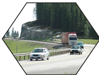
Rv 4, Lygna

Innlandets må være attraktiv for næringsetablering og bosetting. En viktig faktor for å få til vekst knyttet til nye næringsområder som informasjonssikkerhet, kultur- og opplevelsesnæringer, bioteknologi og bioenergi er en funksjonell samferdselsstruktur som knytter ulike områder i Innlandets bo- og arbeidsmarked tettere sammen. Samtidig som Innlandet knyttes nærmere sammen med Osloregionen.