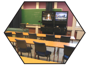
Fra fjernundervisningsrom, HiG