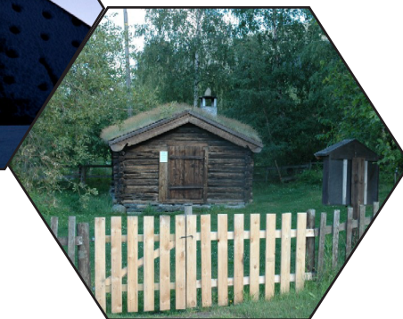
Hamsunstugu i Lom