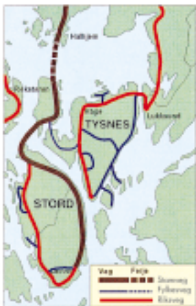
Under Langenuen i tunnel i nord