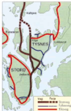
Bru ved Jektevik - Hodanes