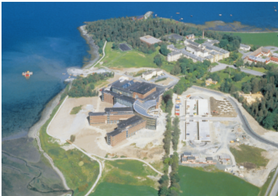
Statoils kontorbygg, Rotvoll, Trondheim kommune. Ferdigstilt i 1993. Tiltaket var meget konfliktfullt. Behandlingen ga føringer for utforming og tilpasning.

* Vedlegg I og II, kolonne III, viser hvilke tillatelser som må avvenne til utredningsplikten er oppfylt. I enkelte saker vil konsekvensutredningen ligge til grunn for vedtak i saken i regjeringen eller Stortinget.