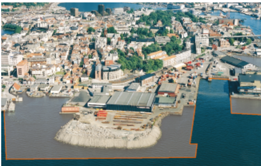
Utvidelse av Bergen havn, 1997. Vedlegg II-tiltak.

*Med regionale miljøvernmyndigheter menes fylkeskommunen som kulturminneforvaltning, fylkesmannen som miljøvernmyndighet og Samisk kulturminneråd når samiske kulturminneinteresser er berørt.