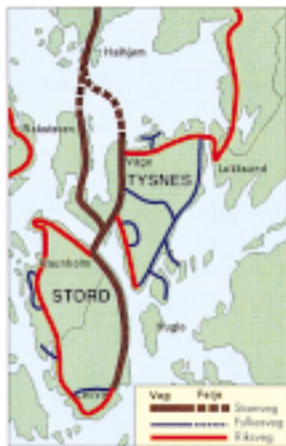
Bru ved Raunholm

Lokaliseringsalternativet skal inntegnes på kart.