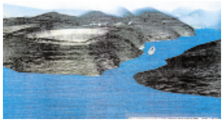
Gode illustrasjoner er viktig. Fra melding om masseuttak i Jøssingfjord, 1992. Prosjektet ble lagt på is. (Ill. Tarmac Heavy Building Materials).