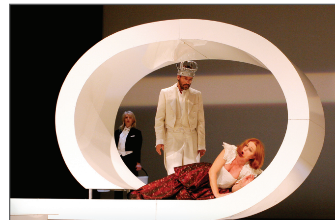
Ophelia, death by water singing av Henrik Hellstenius (musikk) og Cecilie Løveid (tekst)

Konst. operasjef i Den Nye Opera Stein Olav Henrichsen