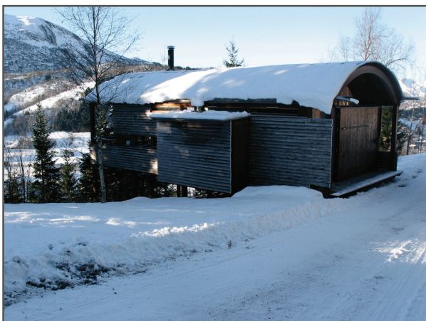
Kunstnerboligene på Dalsåsen