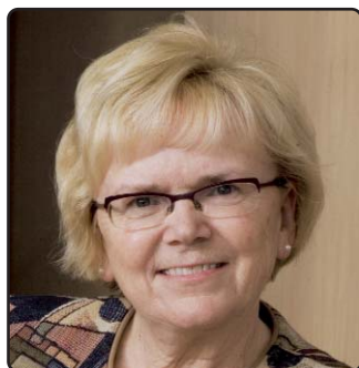
Magnhild Meltveit Kleppa Statsråd – Kommunal- og Regionaldepartementet