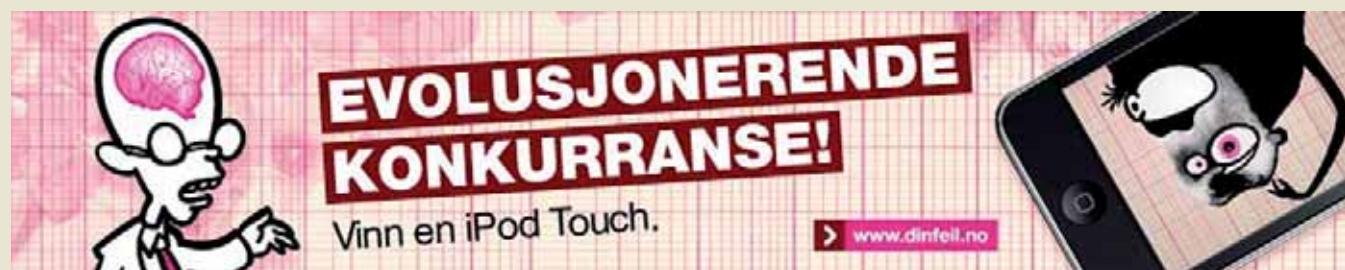
Et av bannerne som brukes under kampanjen

Informasjonsprogrammet universell utforming i byggsektoren etterlyser kommuner som vil være pådrivere for universell utforming. Lokale tiltak og informasjon på servicesentre kan for eksempel være ideer til aktiviteter. Statens bygningstekniske etat og Husbanken har informasjonsmateriell om universell utforming.