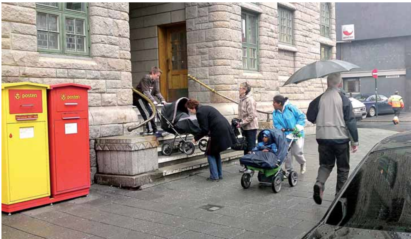
Hovedpostkontoret: Trapp til besvær.