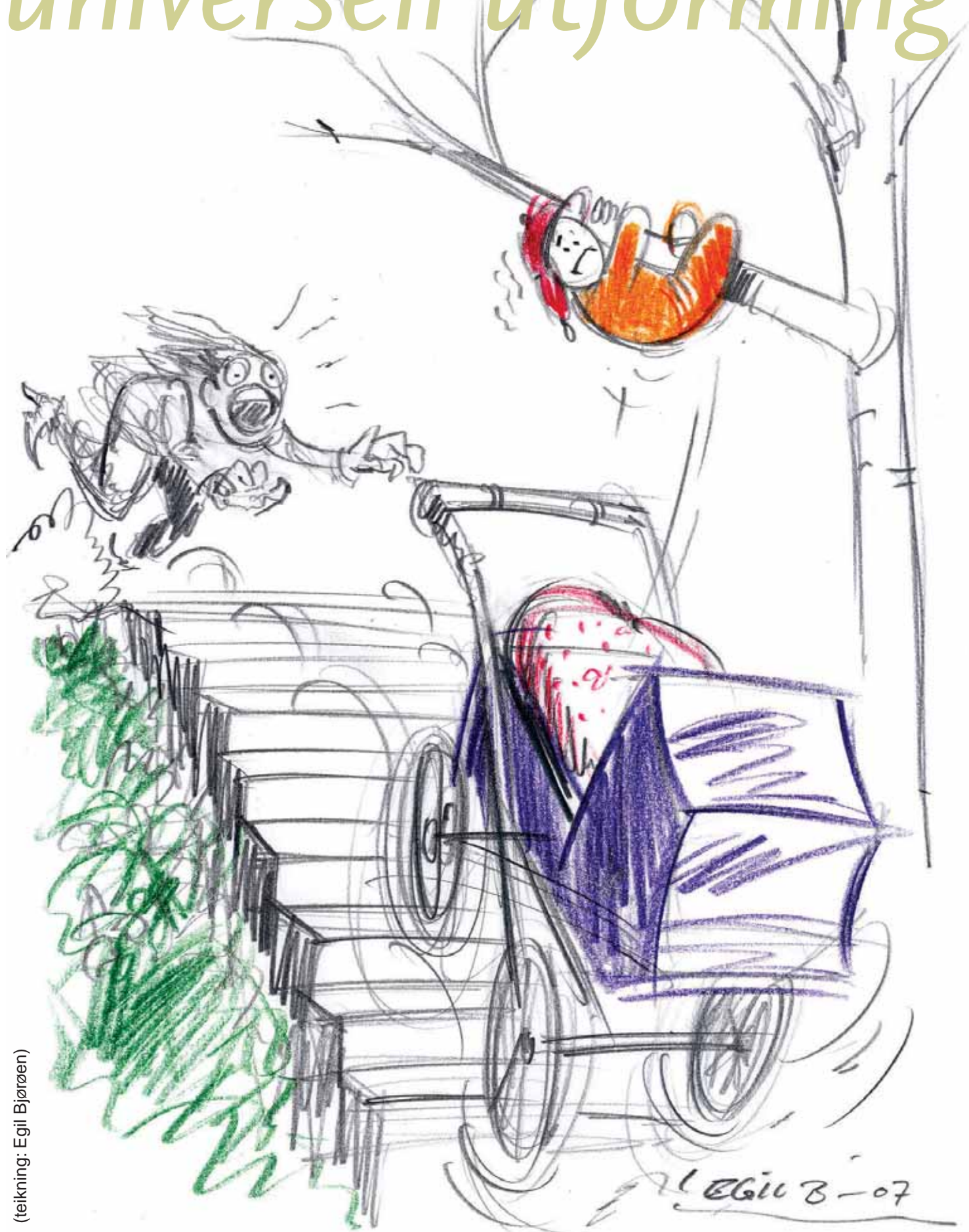
(teikning: Egil Bjørøen)