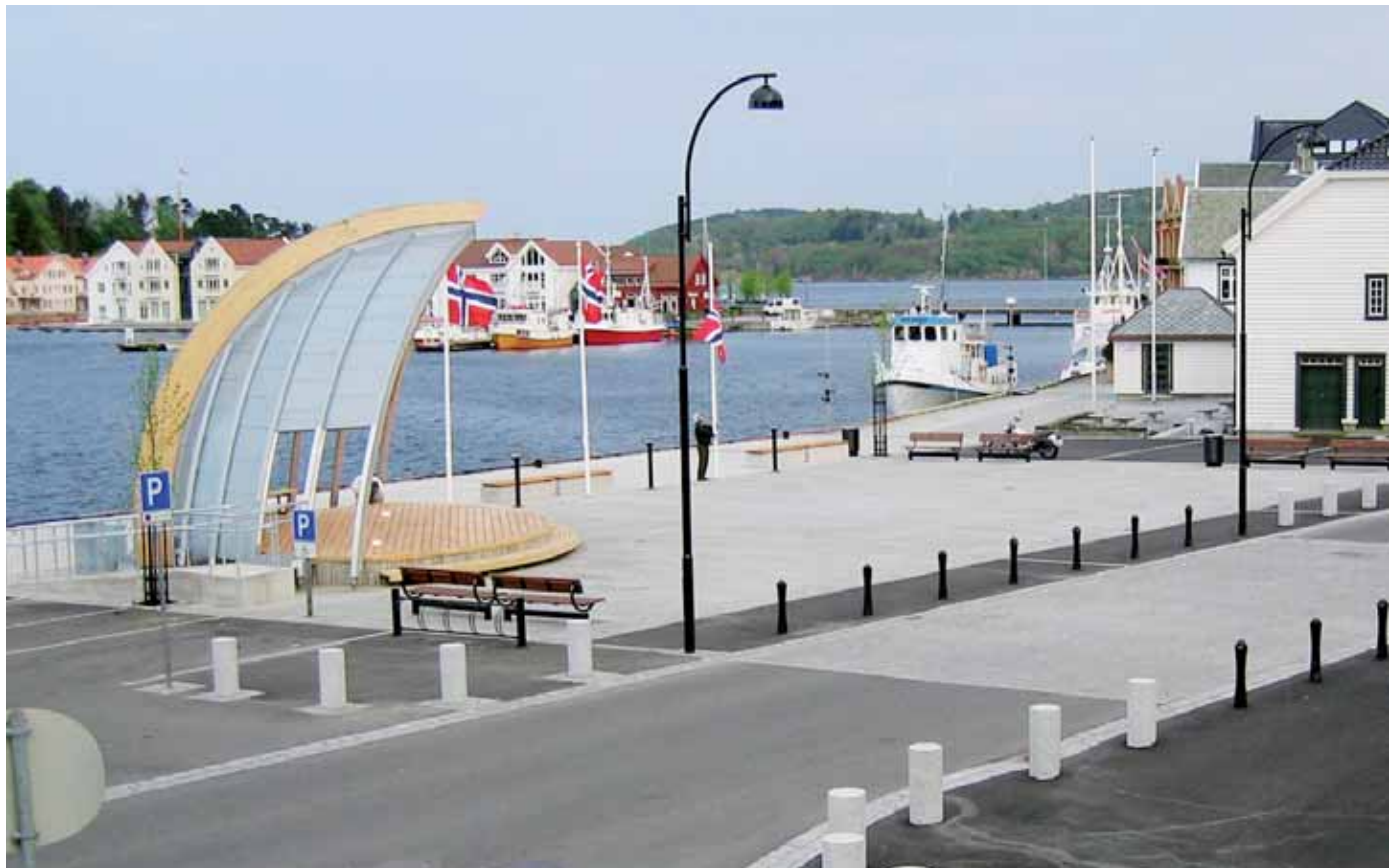
Fra torvet i Farsund med ny godt tilgjengelig utescene.

pende, der samarbeid mellom ulike forvaltningsledd og nivå er viktig. For eksempel inneholder planen et program for å støtte opp om kommunenes