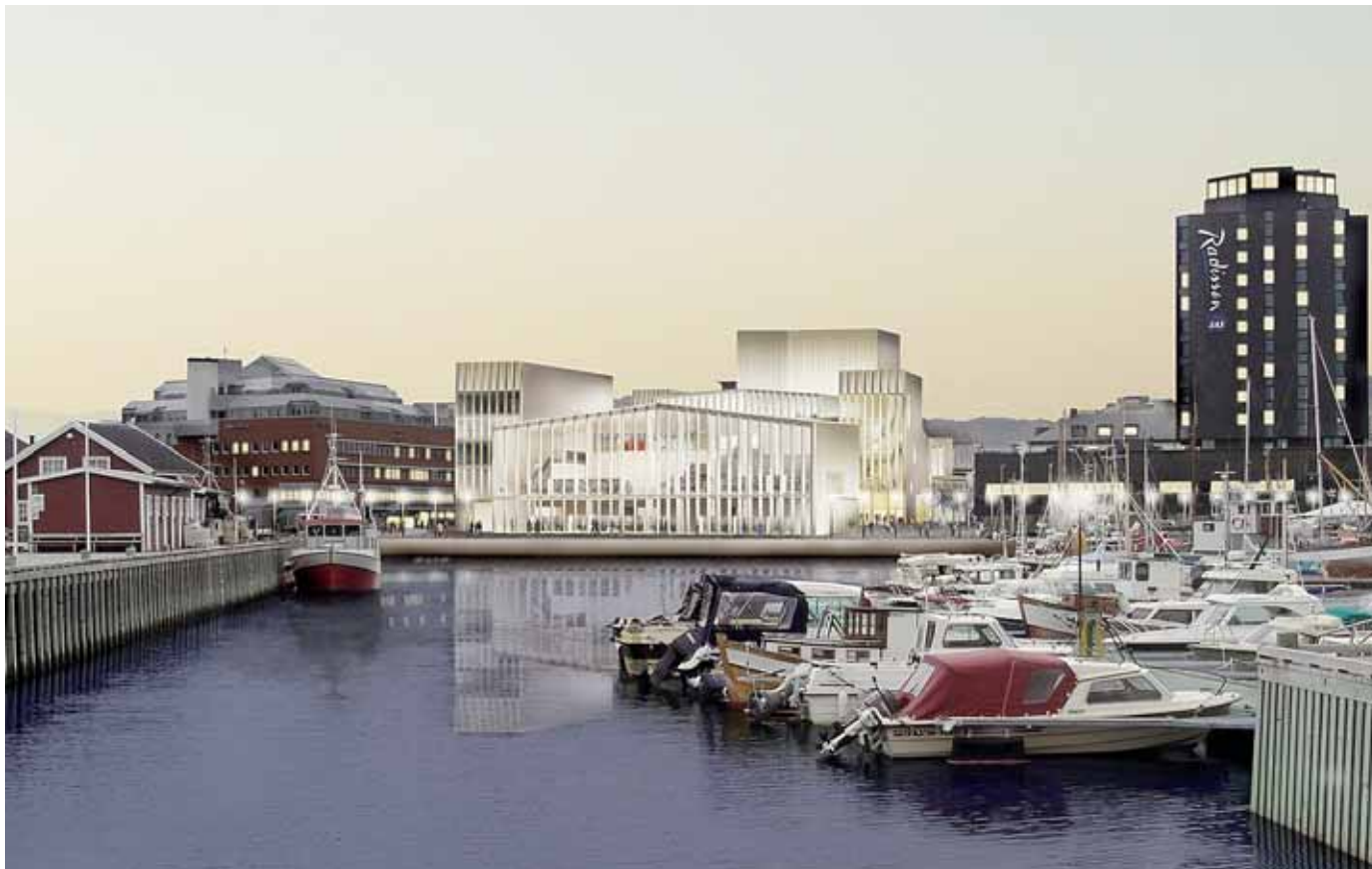
KULTURKVARTALET: Urbane Figurer i Bodø (tegning: DRDArchitects)

– Teknologien vil utvikle seg videre mens Kulturkvartalet reises. Vi skal følge med, søke ny kunnskap hele veien og være bevisst på de nye teknologiske mulighetene som skapes, sier