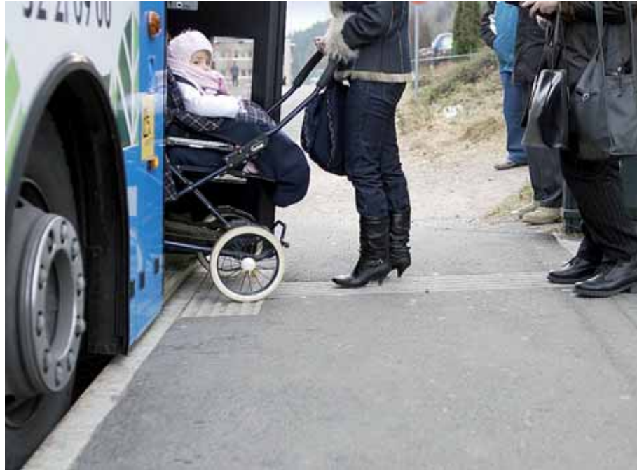
Universelt utformet bussholdeplass med ledelinjer og opphøyet holdeplass for enkel innstigning.

Universell utforming er sentralt i NTP. Ett delmål er at kollektivtransportsystemet skal bli mer universelt utformet. Staten skal satse sterkt på oppgradering både av jernbanestasjoner og på vei. Gjennom NTP settes det av 3,5 milliarder kroner til utvikling av jernbanestasjoner og knutepunkt. 1500-2000 holdeplasser i riksveinettet