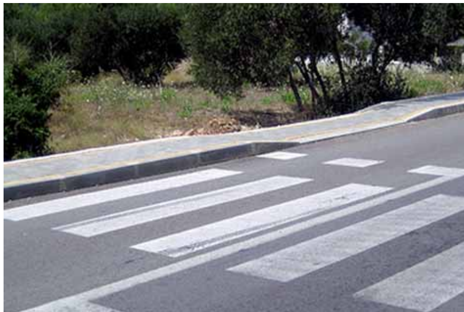
Ikkje akkurat blink: Fotgengarovergang i Kroatia

Folk er positive til universell utforming. Mellom 80 og 90 % er positive til pålegg frå styremaktene om universell utforming av nye allment tilgjengelege nybygg og uterom.