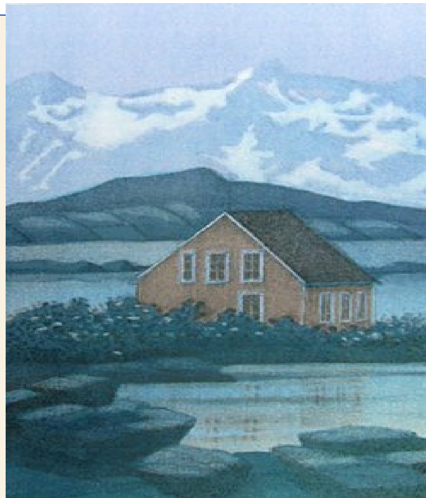
“Hjemlengsel” av Eva Harr