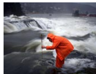
Feltarbeid i Naustdalsfossen