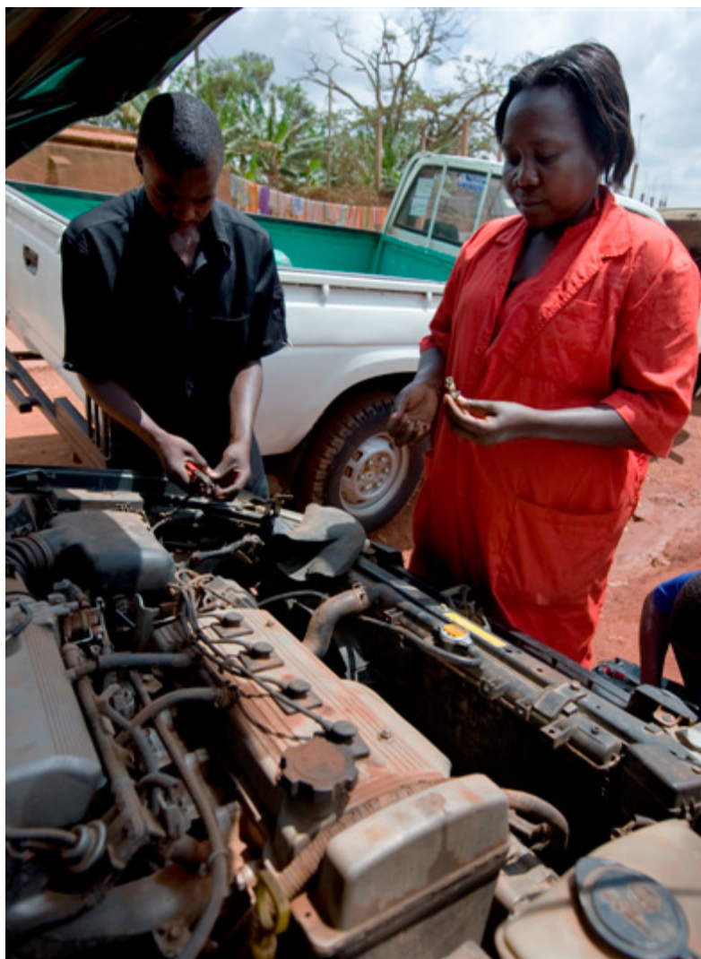
Mukono Motorgarage, Uganda

Investorer etterspør garantiordninger som kan redusere den kommersielle risikoen ved investeringer i utviklingsland. For eksempel er dette et av virkemidlene som potensielle investorer i fornybar energiproduksjon hyppigst etterspør. I tilknytning til de internasjonale klima- og energiinitiativene arbeides det derfor i en rekke land og multilaterale institusjoner med å utvikle garantiordninger som kan redusere de viktigste risikoene som private kraftprodusenter møter i lite utviklede markeder. Norske myndigheters engasjement i å utvikle