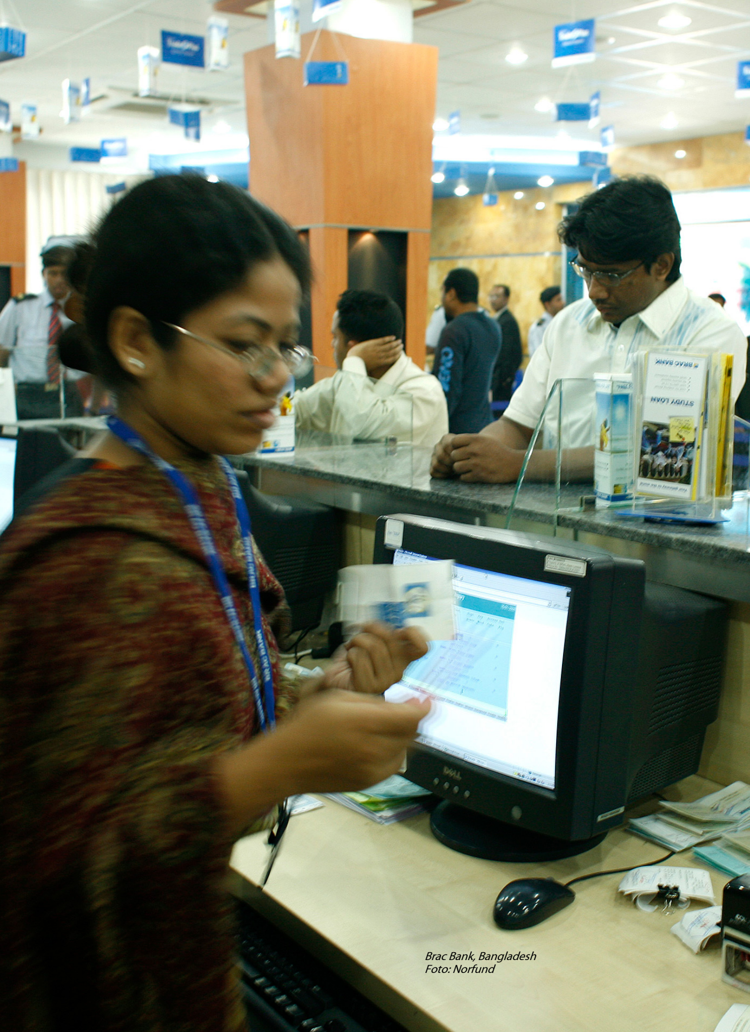
Brac Bank, Bangladesh