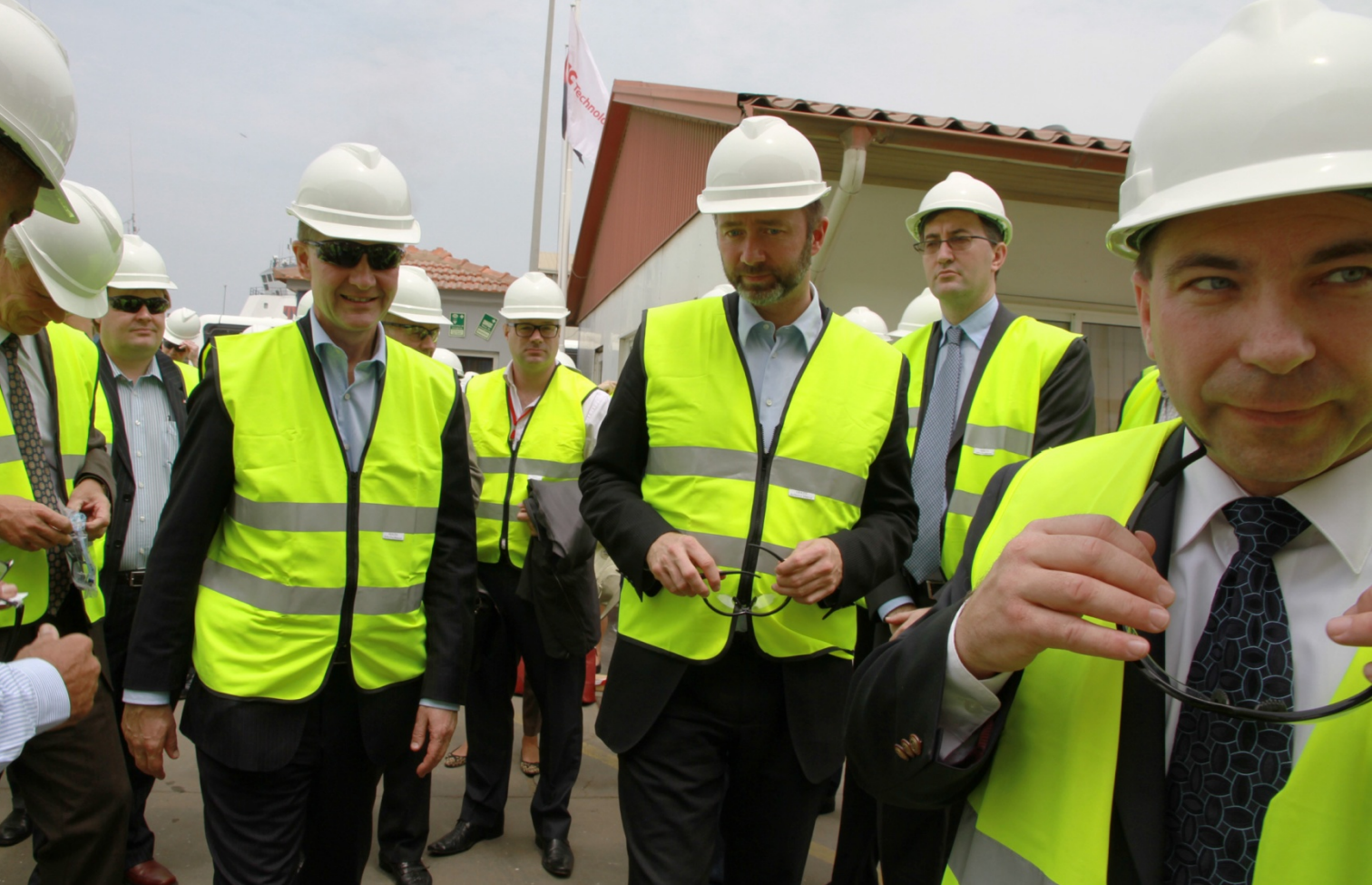
Næringsminister Giske og Miljø- og utviklingsminister Solheim tok høsten 2011 med seg en bredt sammensatt næringslivsdelegasjon på nærmere 100 deltakere på rundreise til Ghana, Angola og Mosambik.