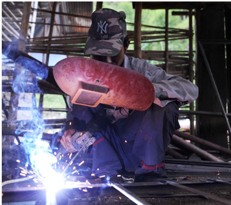
Elektrifisering i Nepal