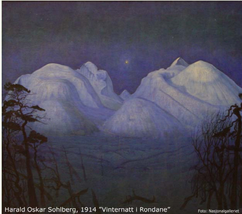
Harald Oskar Sohlberg, 1914 "Vinternatt i Rondane"