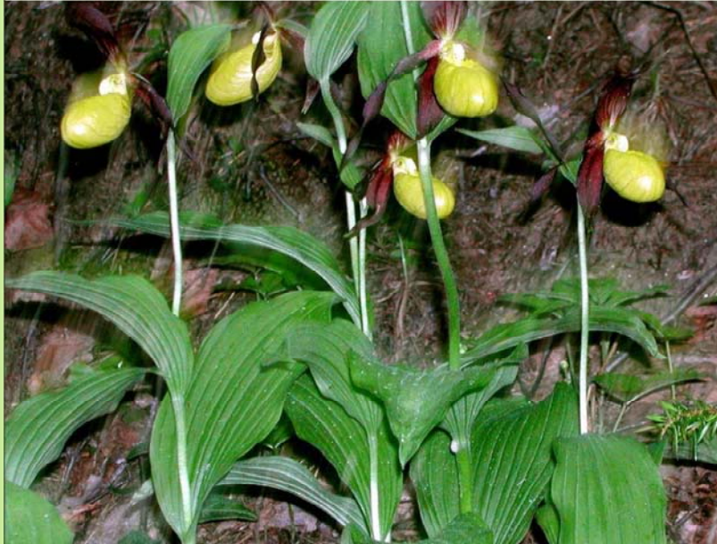
Marisko – Inngår i Junkerdals- ura naturreservat