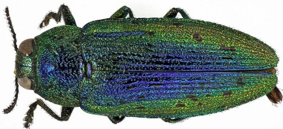
Poecilnota rutilans , Lindepraktbille.

Hengsåsen består av både kalkfuruskog og edellauskog av kalklindeskoger med innslag av både alm og hassel. Det finnes også stedvis store og grovvokste lindetrær. Videre er det funnet et fåtall sjeldne trelevende billearter. Hengsåsen har en god populasjon av den sjeldne praktbilleren Poecilnota rutilans , som tidligere