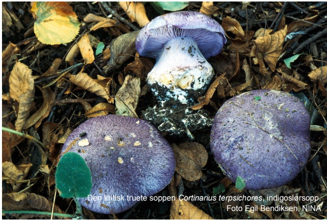
Den kritisk truede soppen Cortinarius terpsichores , indigoslårsopp.

Mykorrhizasoppfloraen på Dronningberget er karakterisert ved en meget høy andel av spesialiserte, kalkkrevende edellauskogsarter som i Norge bare eller nesten bare er knyttet til lind, eventuelt lind og hassel. De fleste av disse antas å representere svært gamle reliktføremster fra varmetida. Inkludert er en art som er endemisk for Oslofjord-området.