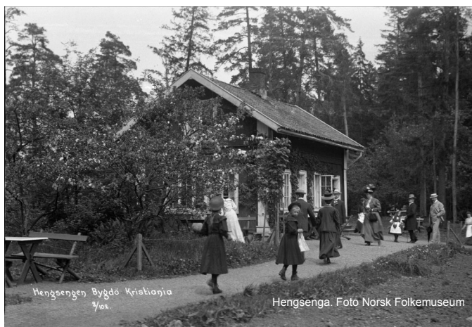
Hengsengen Bygdø Kristiania 3/05.

Selv om Bygdøy ikke ble landfast før på 1800-tallet, har det vært bosetning i området siden steinalderen. I middelalderen vekslet eierskapet til øya mellom klosteret på Hovedøya og kongen. Ved reformasjonen ble Bygdøy krongods, underlagt Akershus slott som ladegård. I 1837 kjøpte kong Karl Johan et større område på Bygdøy for egne midler. Han ønsket å tilrettelegge området som folkepark for allmuen, slik han også gjorde i Djurgården i Stockholm.