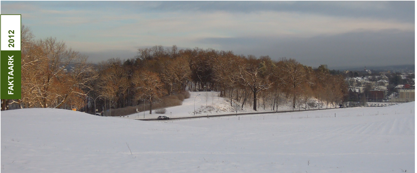
Dronningberget i vinterdrakt.