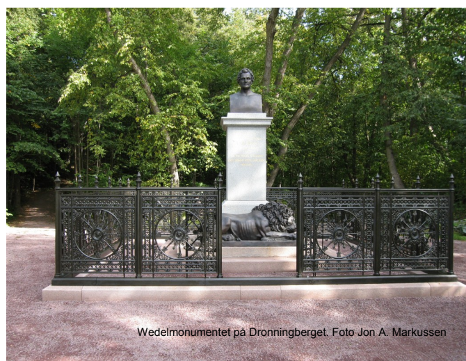
Wedelmonumentet på Dronningberget.

Etter 1905 har folkeparken og severdighetene der i stor grad forfalt. Noen kulturminner er allerede istandsatt, slik som Sæterhytten. Andre skal settes i stand i årene som kommer. Deler av park- og hageanleggene er i dag i stor grad gjengrodd. Det mangfoldige natur- og kulturlandskapet gir oss, sammen med de enkelte kulturminnene i den gamle Folkeparken, kulturmiljøet på Bygdøy.