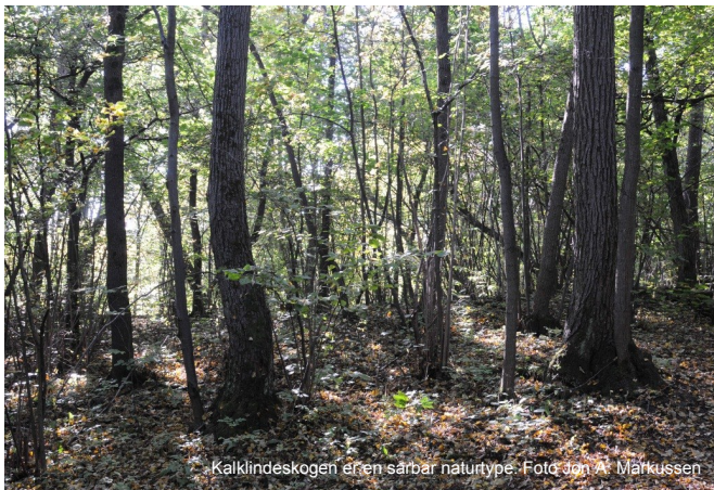
Kalklindeskogen er en sårbar naturtype.

Dette indikerer at lokaliteten representerer en ekstrem økologisk kontinuitet, trolig med uavbrutt lindeskog gjennom 4-8000 år. Skogen representerer således et av de eldste naturdokumentene i Oslofjordsområdet.