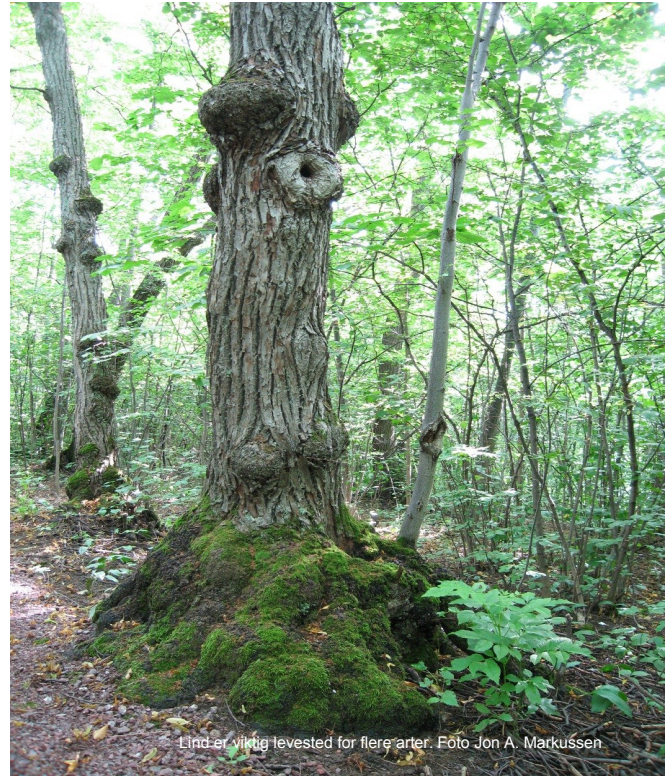
Lind er viktig levested for flere arter.

kun er funnet er par ganger i Asker og en gang i Ytre Telemark. Disse funn synes å representere en isolert forekomst i Skandinavia, da arten verken er kjent fra Sverige eller Danmark.