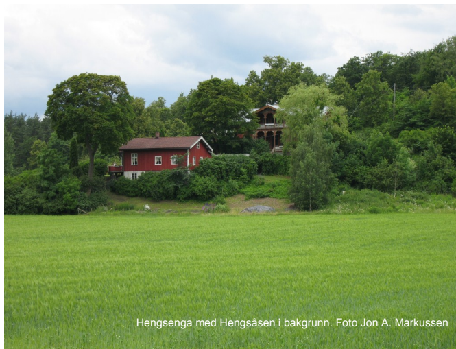
Hengsenga med Hengsåsen i bakgrunn.

Fredningen av kulturmiljøet på Bygdøy sikrer en unik kilde til kunnskap, opplevelse og bruk for alle, i dag og i framtida. Naturrestatene Dronningberget og Heng-