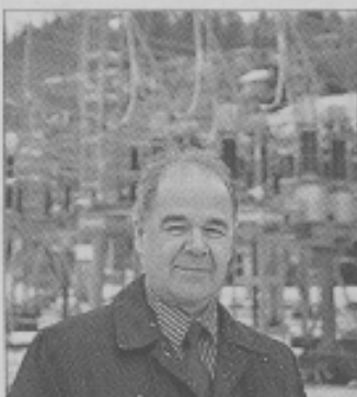
NETTSIKKER. Statnett skal bruke