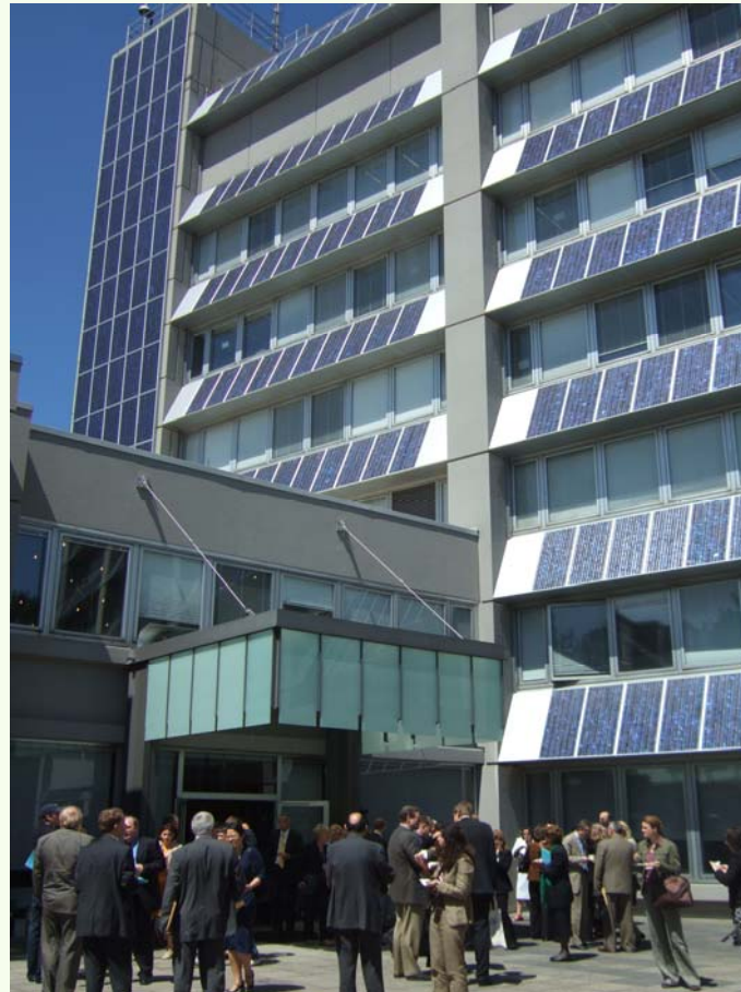
Nye energikrav til bygg