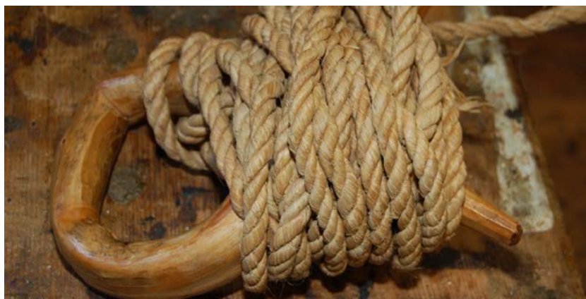
Reip av lindebast.

Dersom man skulle ha vanskelig for å se dette for seg, kan det godt være fordi mange oss ikke har sett en slik skog, de er nemlig i ferd med å forsvinne. Kalklindeskogene befinner seg i hovedsak i områder med press på utbygging og annen menneskelig aktivitet. Den har hatt en dramatisk tilbakegang. Anslagsvis er 20-30 prosent forsvunnet de siste 50 årene. Kalklindeskogene er godt kartlagt i Norge. Forskerne kjenner til 46 lokaliteter i Oslofjordområdet, inkludert enkelte områder langs Eikeren, Tyrifjorden og Mjøsa. Det vil si at det er snakk om en svært sjelden naturtype, ikke minst med tanke på at den, med enkelte få unntak, bare finnes i Norge.