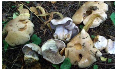
Krattslørsoppen er kjent fra mindre enn 10 lokaliteter i kalklindeskoger.

At kalklindeskogene er så vidt sjeldne, er selvsagt svært uheldig. Men det er altså ikke selve lindetreet som er spesielt truet. På samme måte som en klassisk skattkiste, hvor det ikke er selve kisten som er verdifull, men innholdet, er det den unike samlingen av sjeldne arter som gjør at kalklindeskogene bør innlemmes i betegnelsen "norsk naturs arvesølv". Her finnes blant om lag 40 forskjellige jordboende sopper, såkalte kalklindeskogsopper, som nesten uten unntak bare vokser i denne naturtypen.